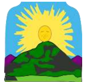
Schéma de l'extrait écouté :