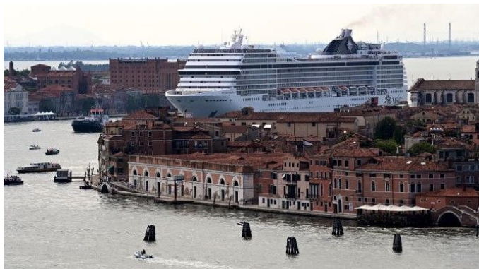
Le « MSC Orchestra » passe dans le canal de Giudecca, en plein Venise, le 5 juin 2021. Depuis le 1er août, cet itinéraire est interdit aux grands bateaux de croisière.

Depuis le 1er août, les bateaux de plus de 25 000 tonnes n'ont plus le droit de traverser le centre historique de Venise et sont contraints de s'amarrer dans le port industriel de Marghera. Une solution ni économiquement ni écologiquement durable pour la lagune.