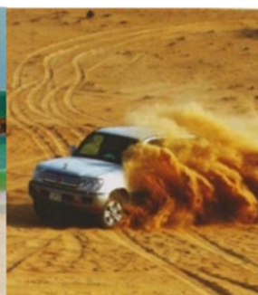
4X4 dans le désert