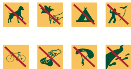
Document 4 : Les loups dans le Parc de la Vanoise, d'après le site internet officiel

« Un Parc National est un territoire d'exception, ouvert à tous sous la responsabilité de chacun. Il est protégé par une réglementation. Merci de la respecter. »