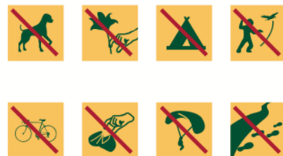
Document 4 : Les loups dans le Parc de la Vanoise, d'après le site internet officiel

« Un Parc National est un territoire d'exception, ouvert à tous sous la responsabilité de chacun. Il est protégé par une réglementation. Merci de la respecter. »