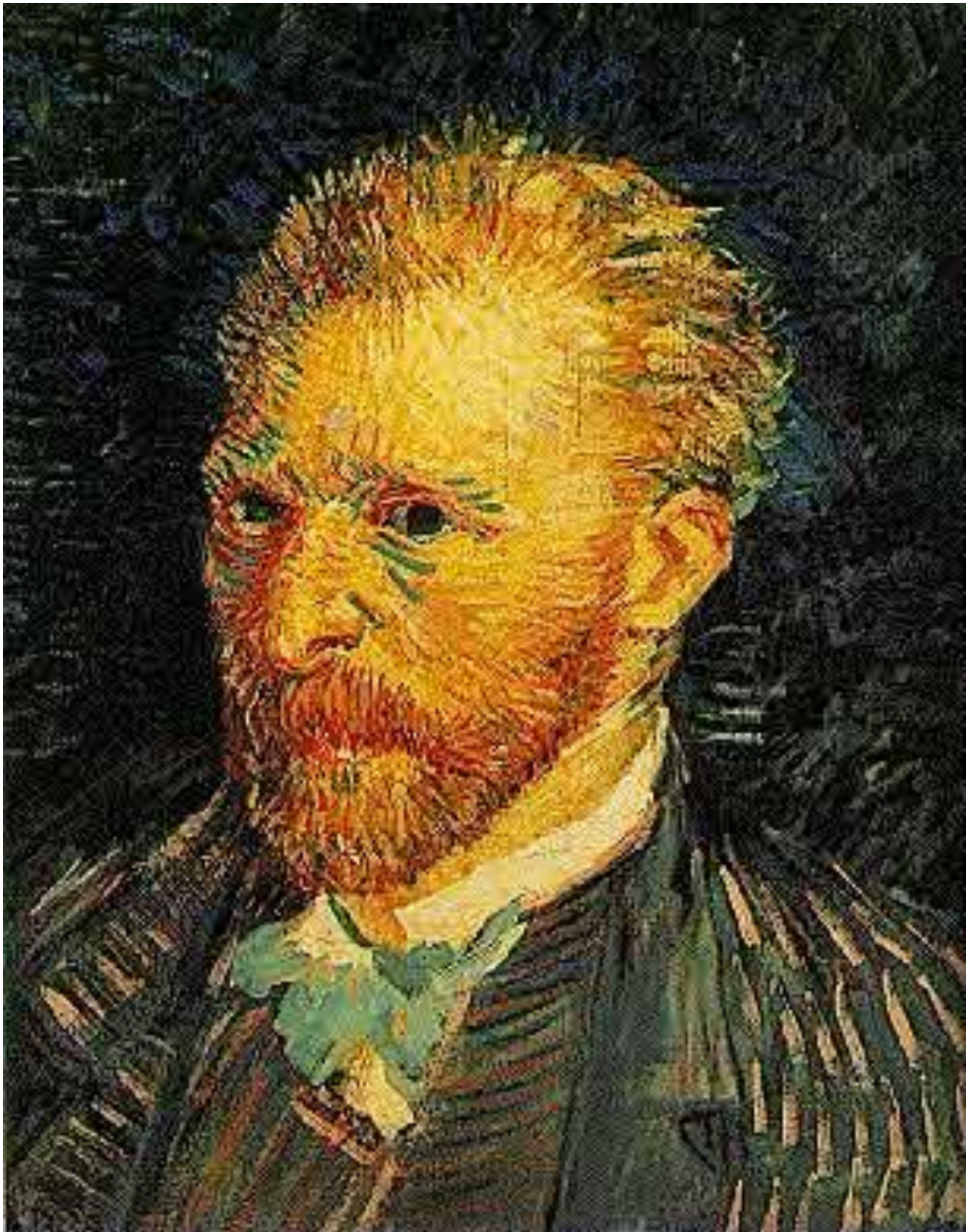
Autoportrait, Van Gogh