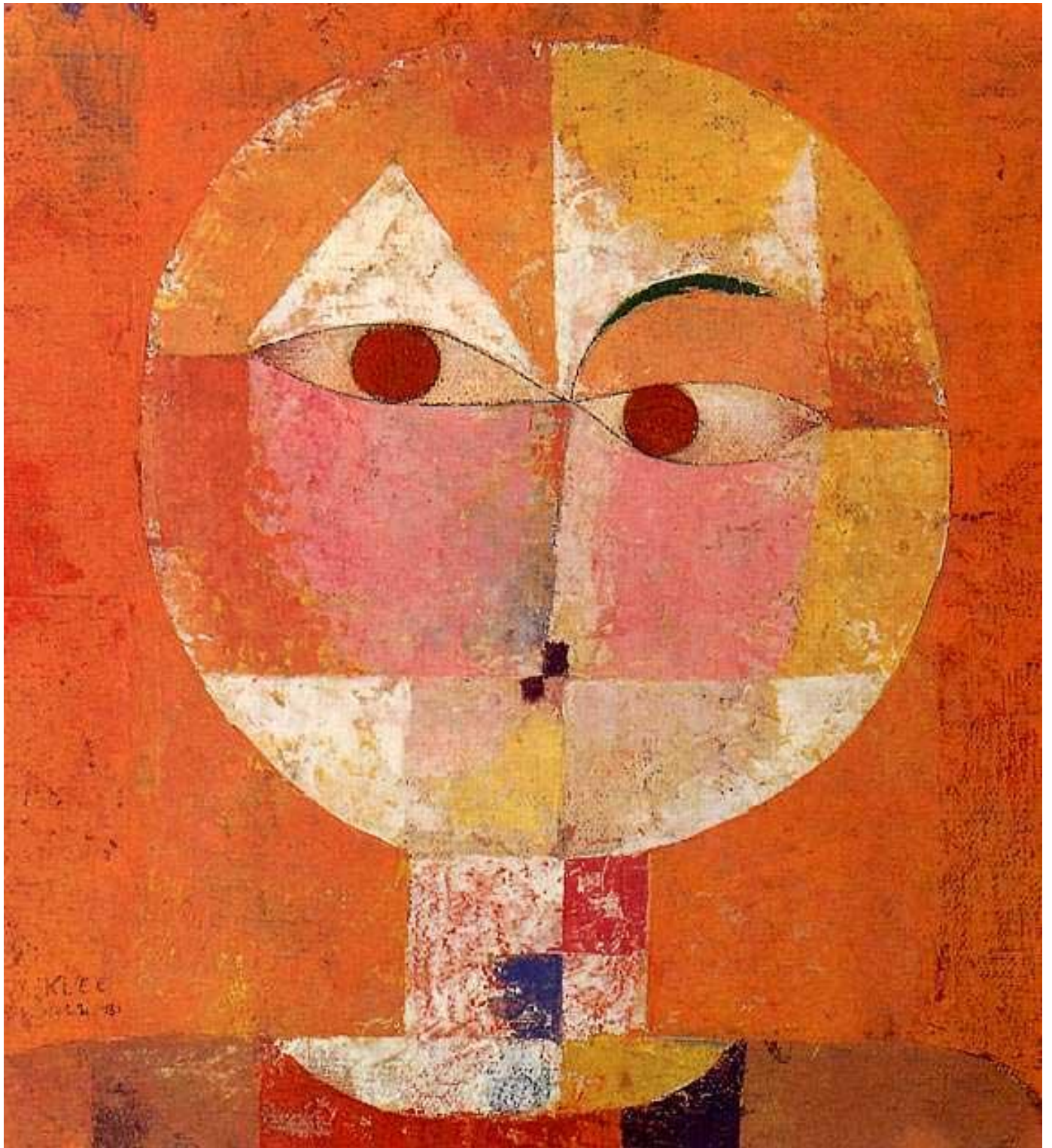
Head of man, Klee