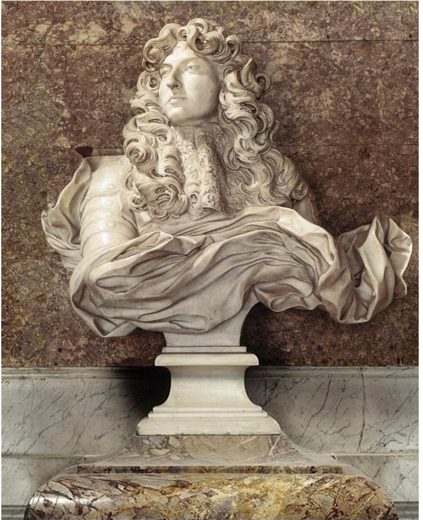
Buste de Louis XIV, Le Bernin