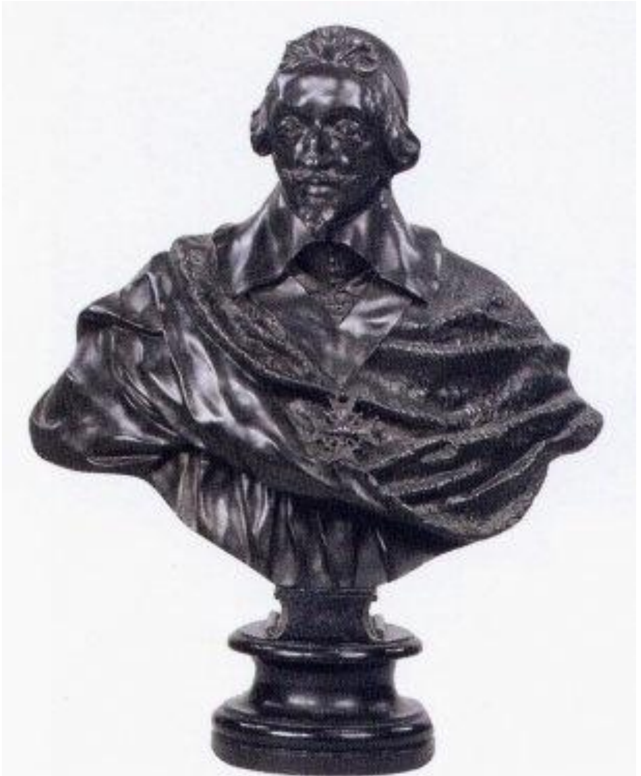
Buste de Richelieu, Jean Warin