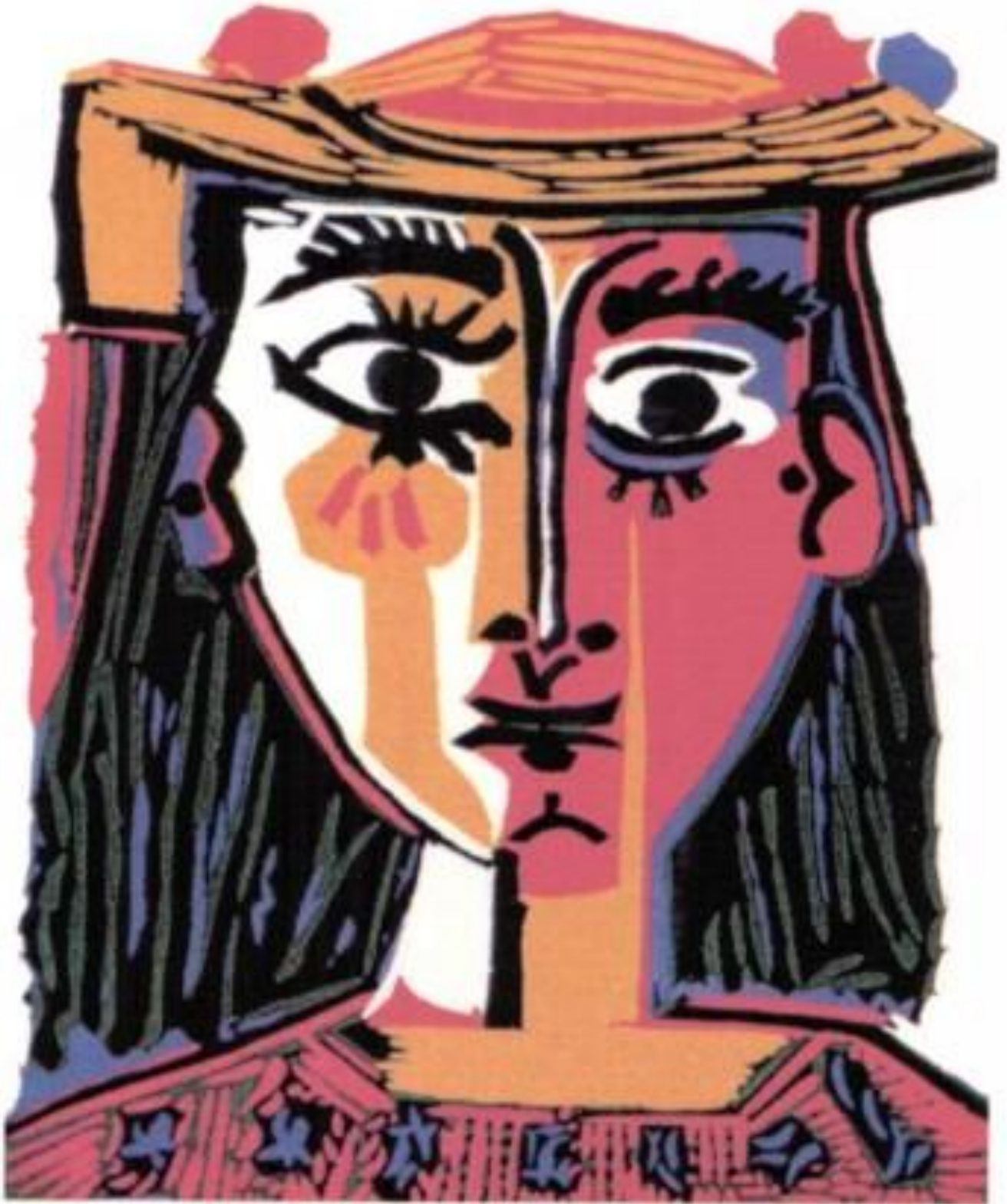
Buste de Femme au chapeau, Picasso