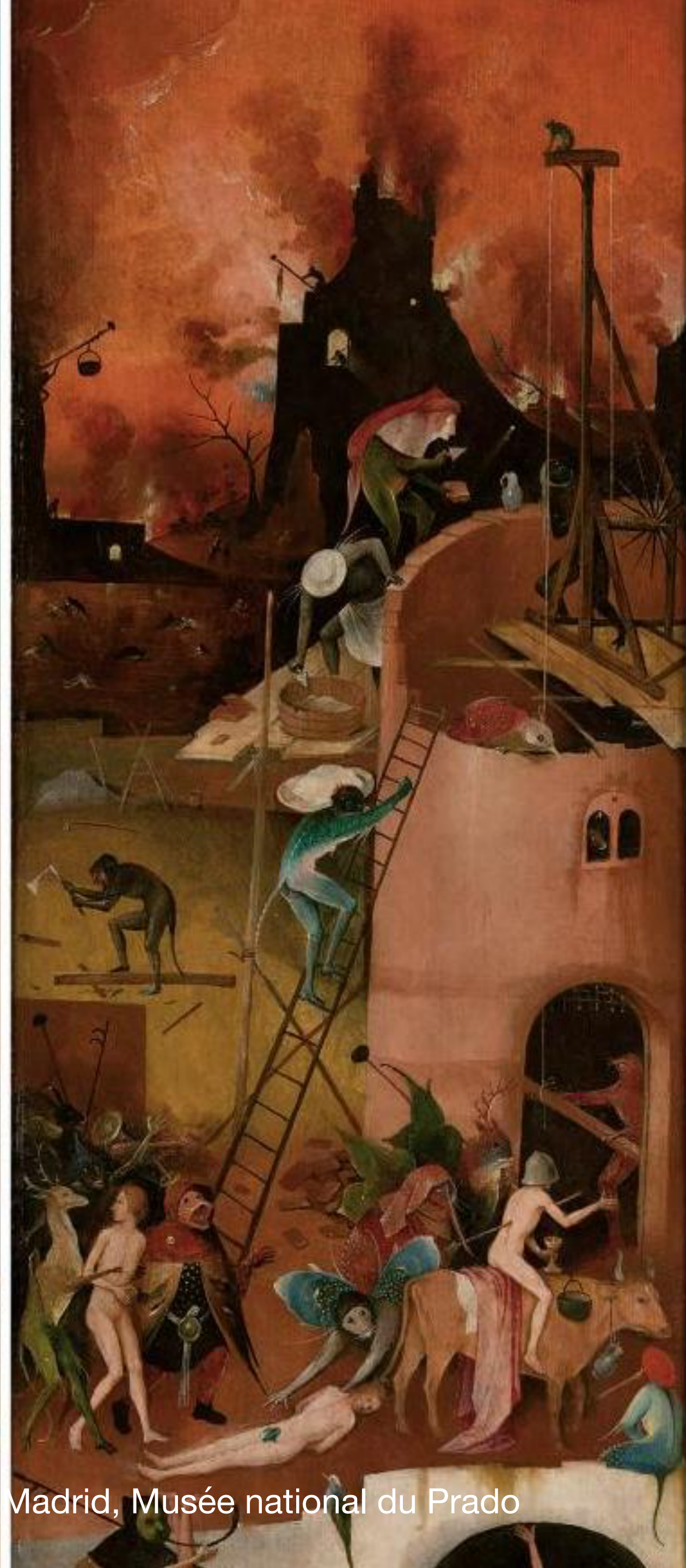
Jérôme BOSCH, Le chariot de foin, 1510-1516, Madrid, Musée national du Prado