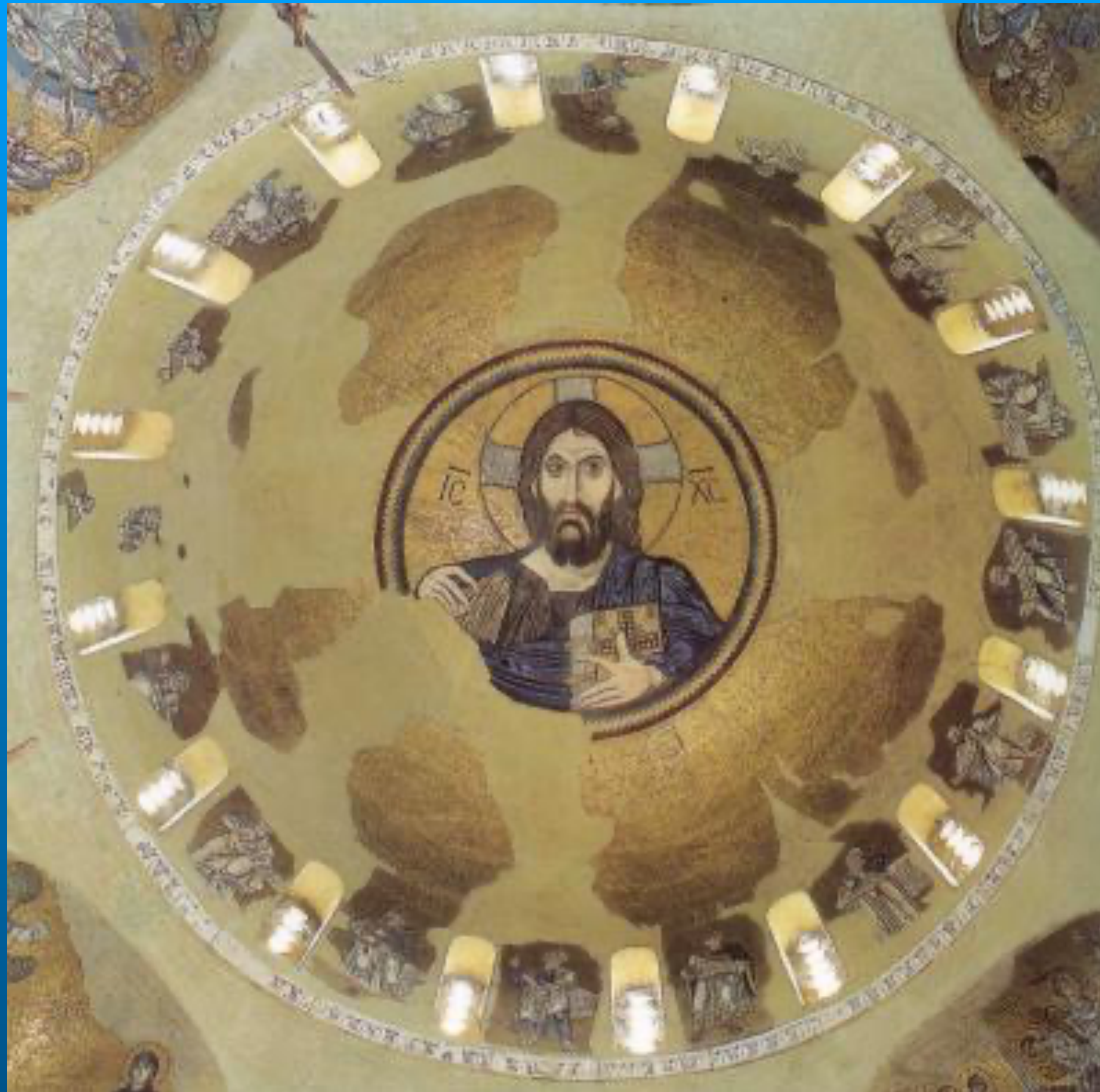
Le monastère byzantin de Daphni XIe siècle