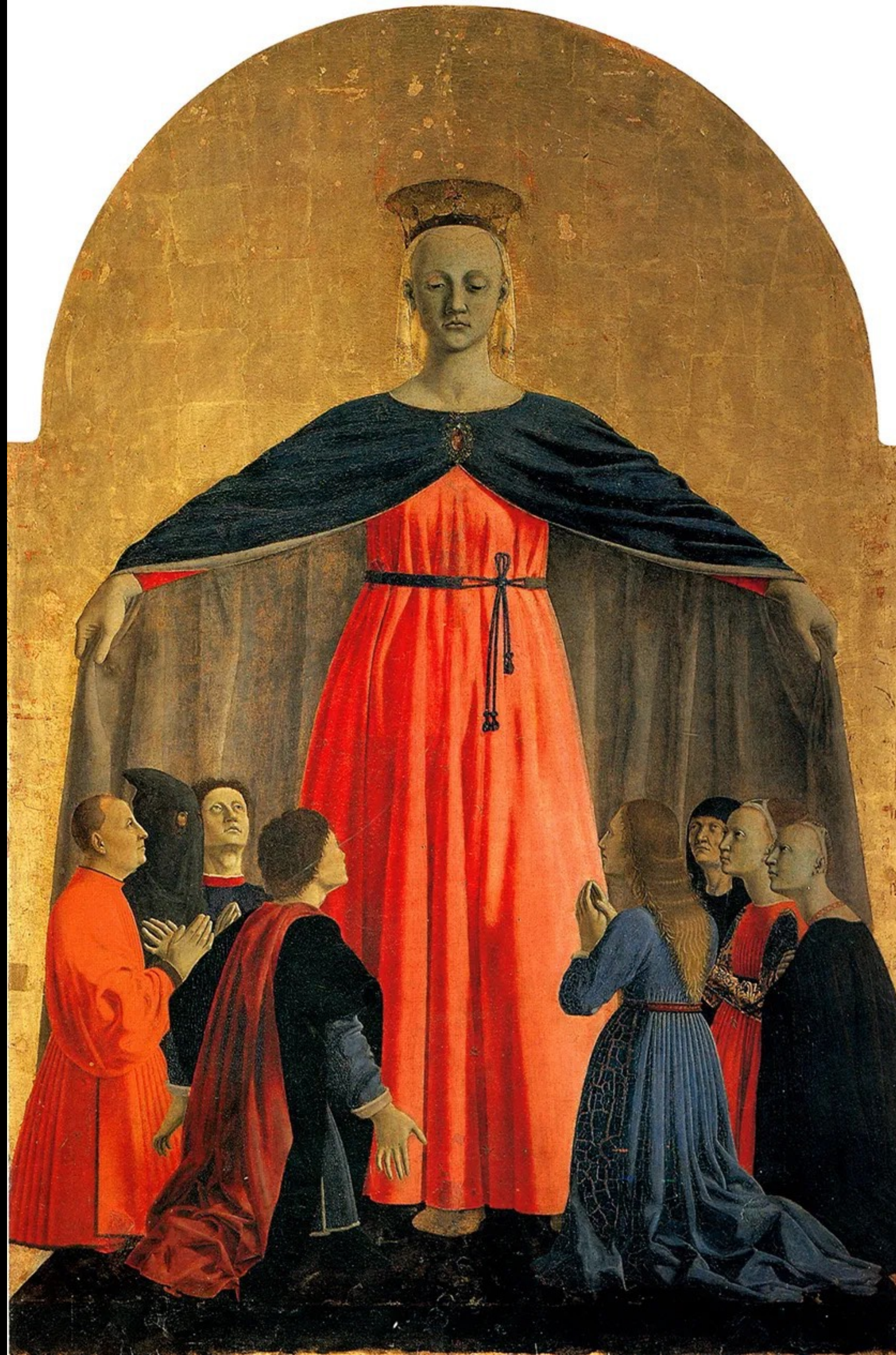
Piero DELLA FRANCESCA, Vierge de Miséricorde , panneau central, vers 1494, Sansepolcro, Musée Civico