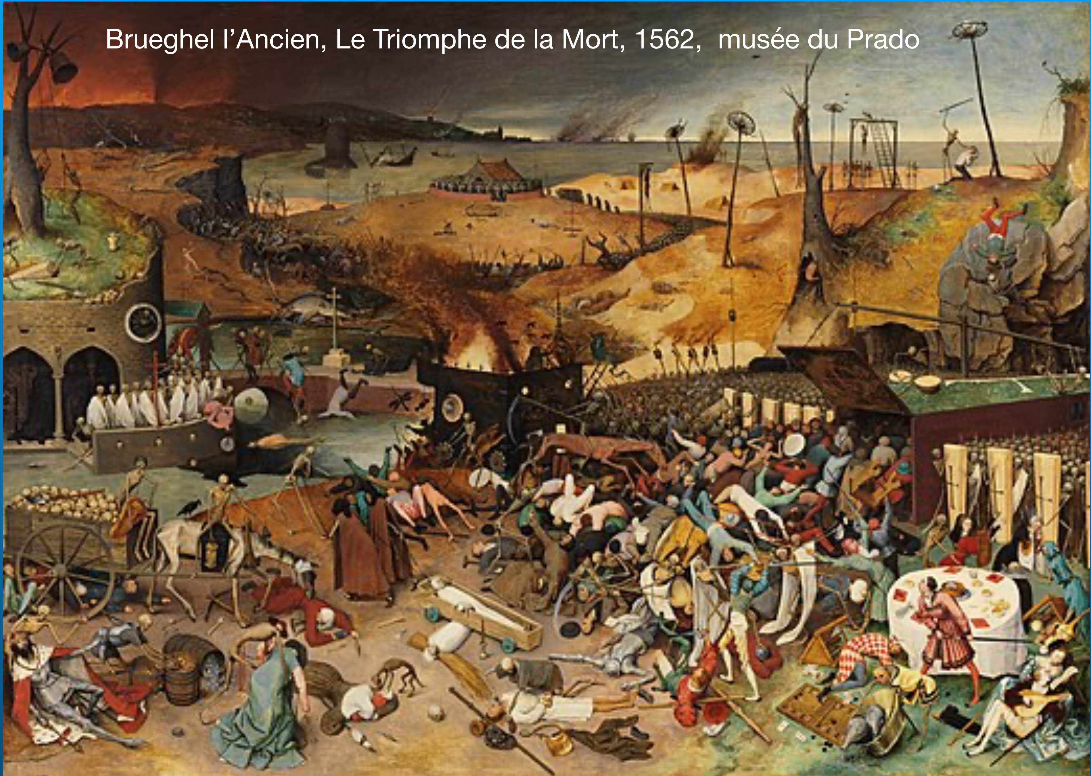
Brueghel l'Ancien, Le Triomphe de la Mort, 1562, musée du Prado