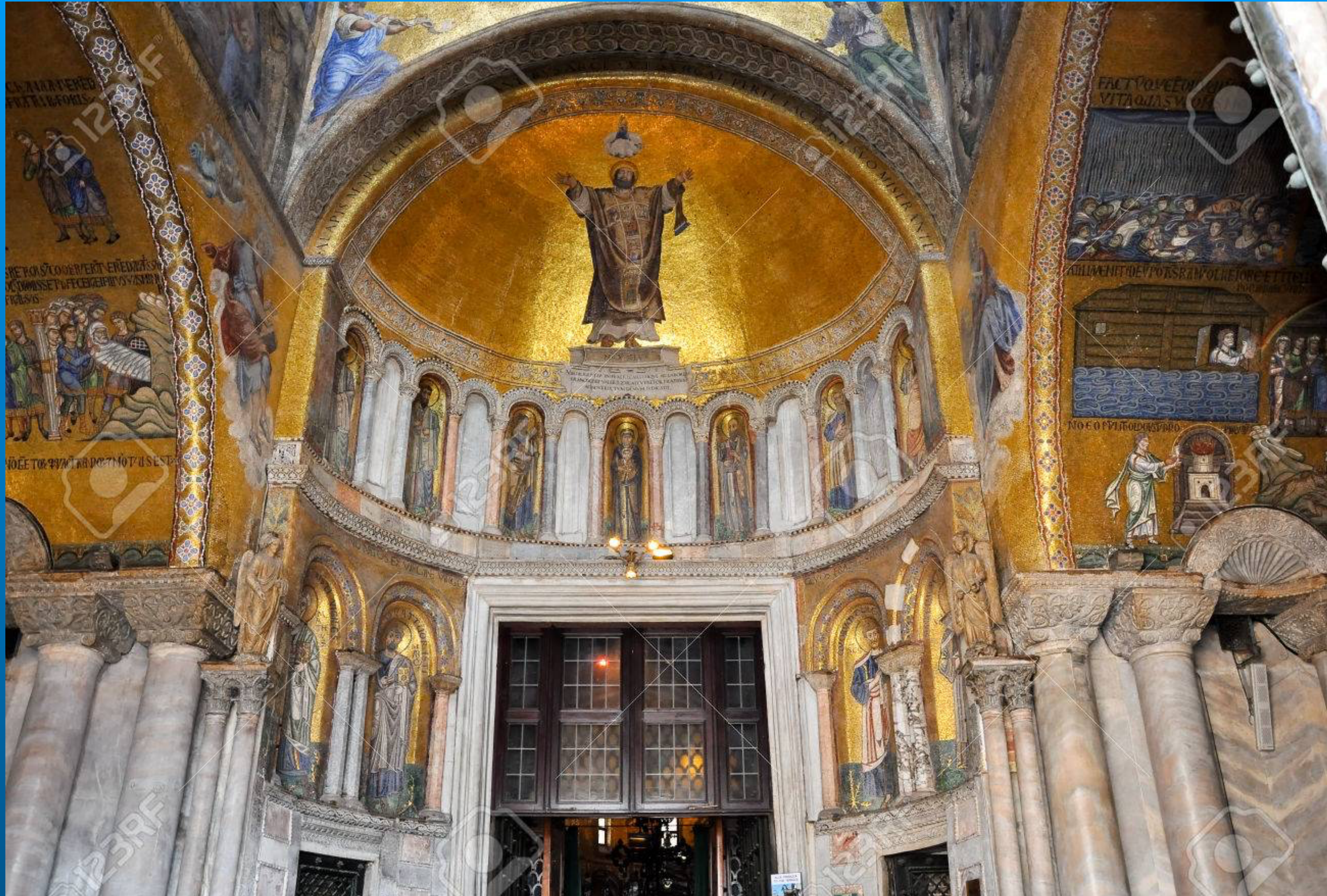
Basilique Saint Marc à Venise - 13e