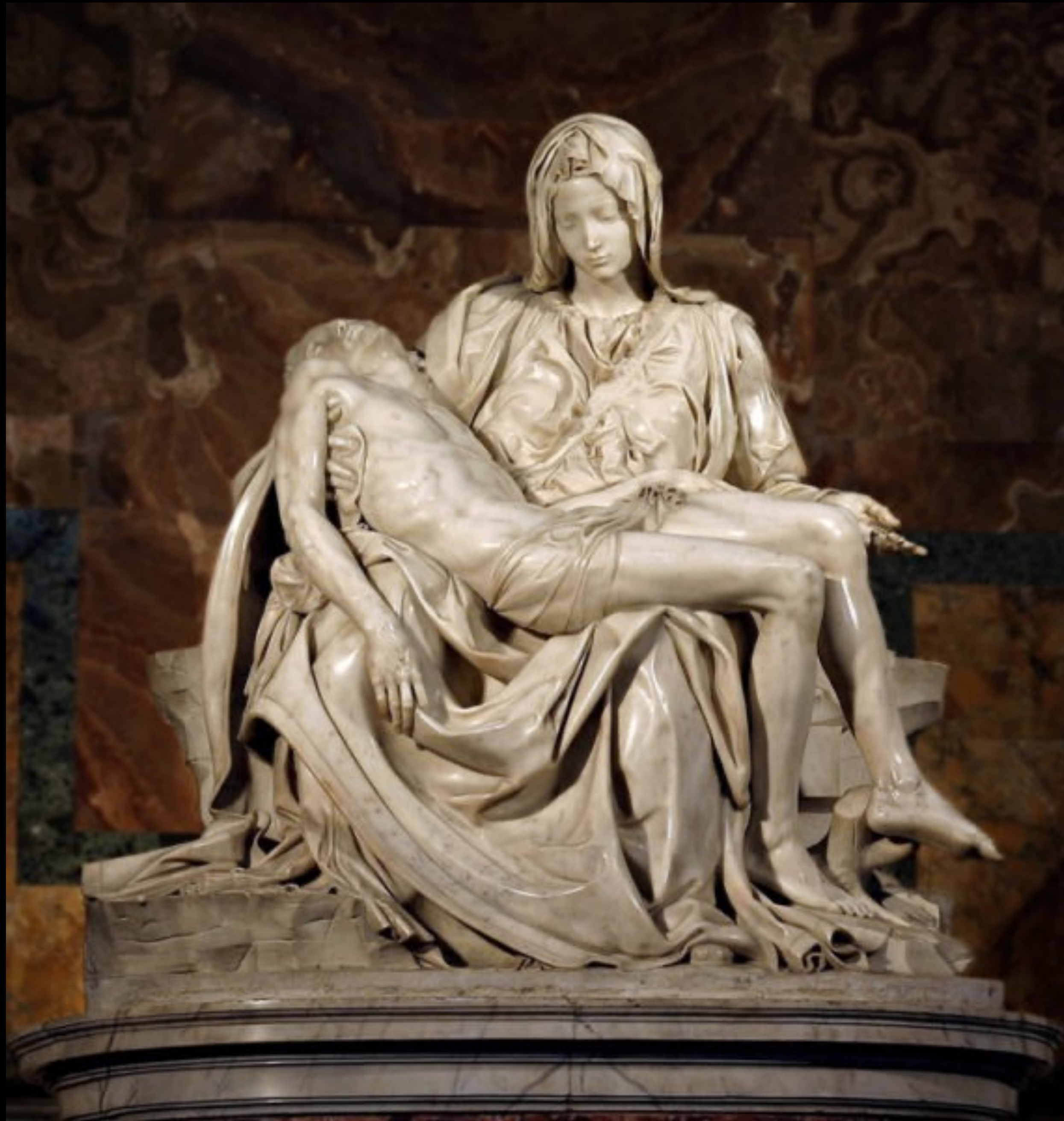
Michel-Ange, Pieta , 1499, Vatican