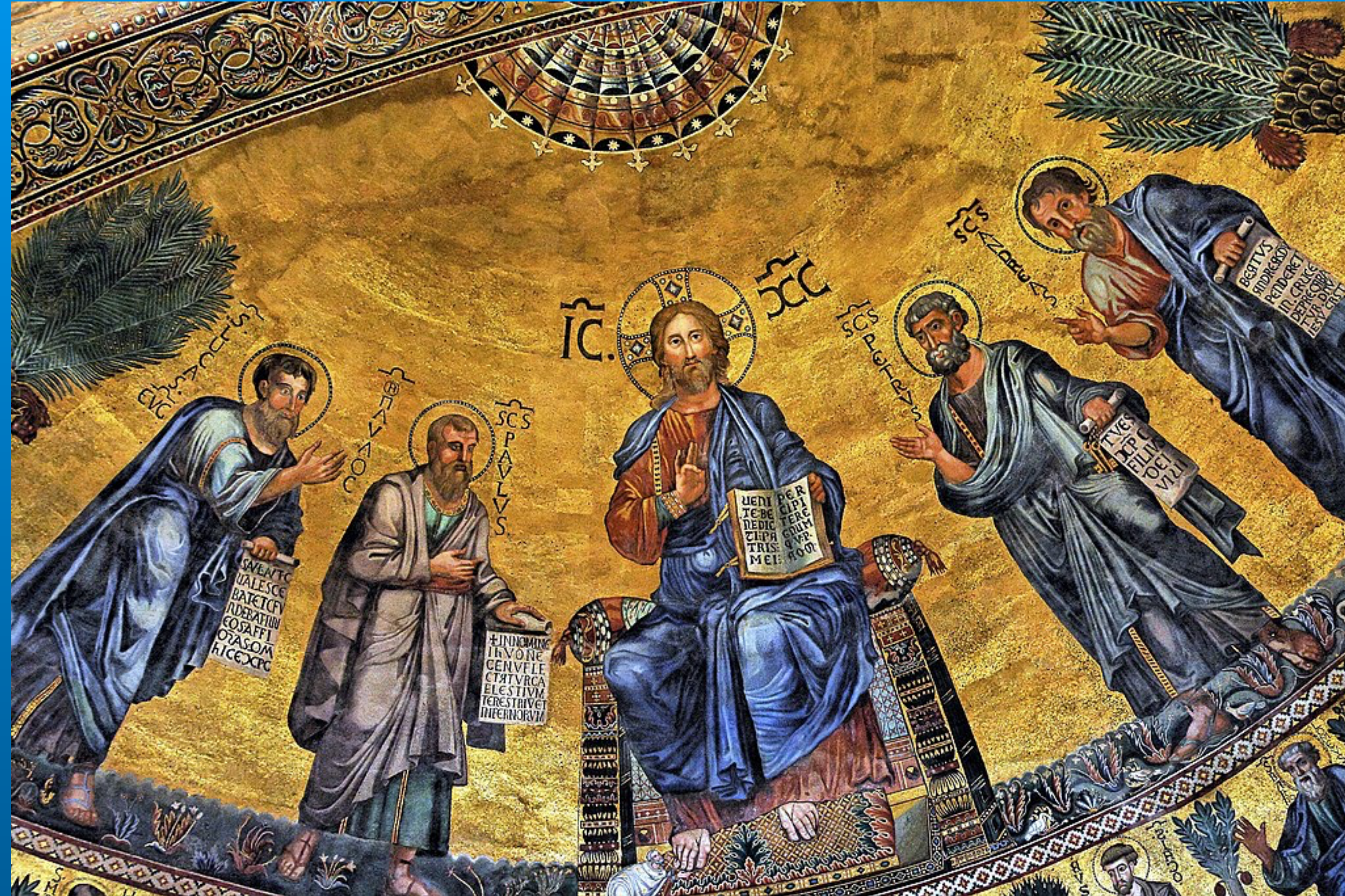
Mosaïque de la basilique Saint-Paul-hors-les-Murs à Rome, Ve avec de nombreux aménagement