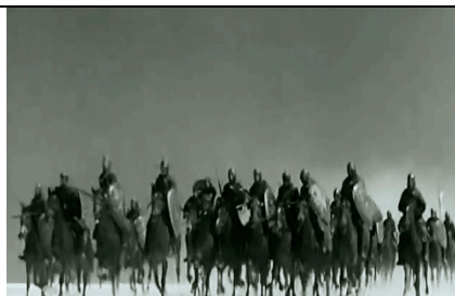
Partie 3 : Thème des russes