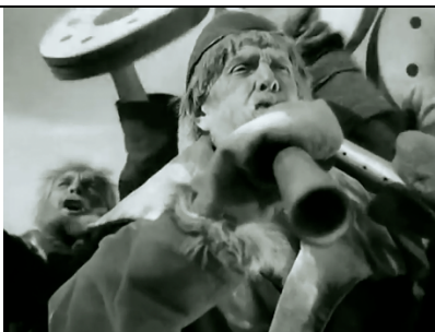
Partie 4: Thème bis des Russes traditionnel