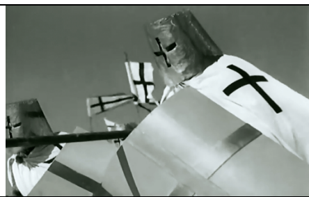
Partie 1 : le thème des croisés