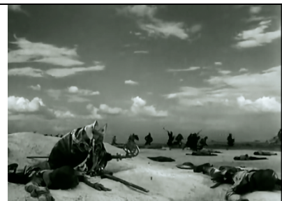
Partie 5 : bataille

Thème des russes qui attaque l'ennemi de revers Tempo Nuance Staccato, tout les pupitres des vents, Caractère