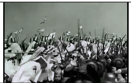
Partie 2 : bataille

Tempo Nuance Sentiment : Comment le montrer en musique :