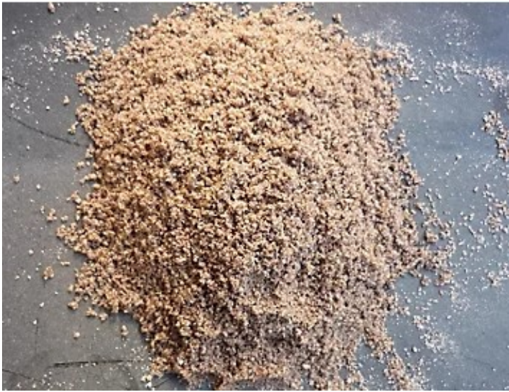
Sable de la boîte A