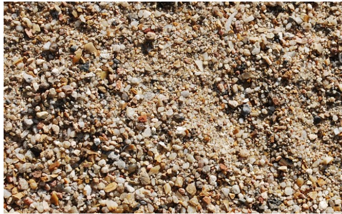
Sable de la boîte C