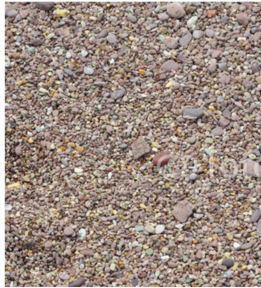
Sable de la boîte B