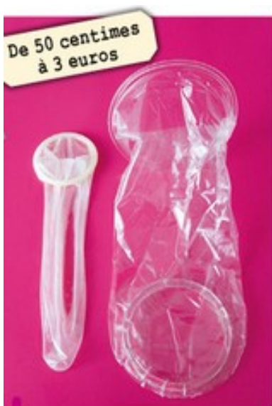
Préservatifs masculin et féminin.