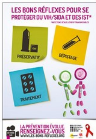
Campagne d'information.

Document n°3 : Une campagne d'informations et de prévention demande un investissement financier important.