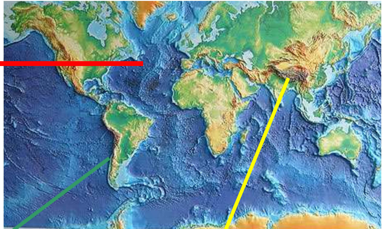
Document n°1 : frontières de plaques et reliefs terrestres