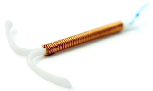
Schéma du positionnement d'un stérilet dans l'utérus.

Le stérilet a une forme de T, il va engendrer une inflammation permanente de la muqueuse utérine, la rendant impropre à la nidation (nidation= fixation de l'embryon marquant le début d'une grossesse).