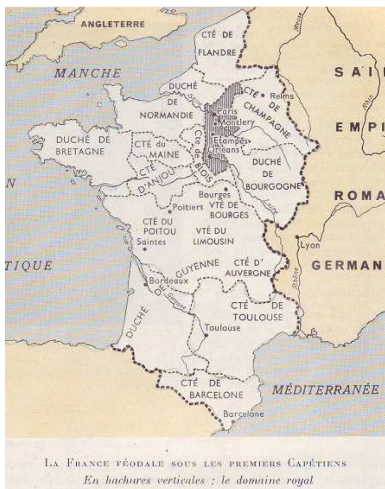
Carte établie par E. Personne et P. Ménard, Nathan, 1963 – le "domaine royal" est celui des capétiens vers 1087, avant Philippe-Auguste, sous la féodalité.

Les soldats en maraude, souvent mercenaires; les bandits, les pillards, trouvaient plus aisé d'utiliser leur force pour piller les greniers des fermes une fois les récoltes terminées, ou emporter le bétail. Les paysans riches, ou leur seigneur, construisaient des fermes fortifiées pour mieux se défendre et protéger le grain et les bêtes si utiles en cette période où la famine était fréquente.