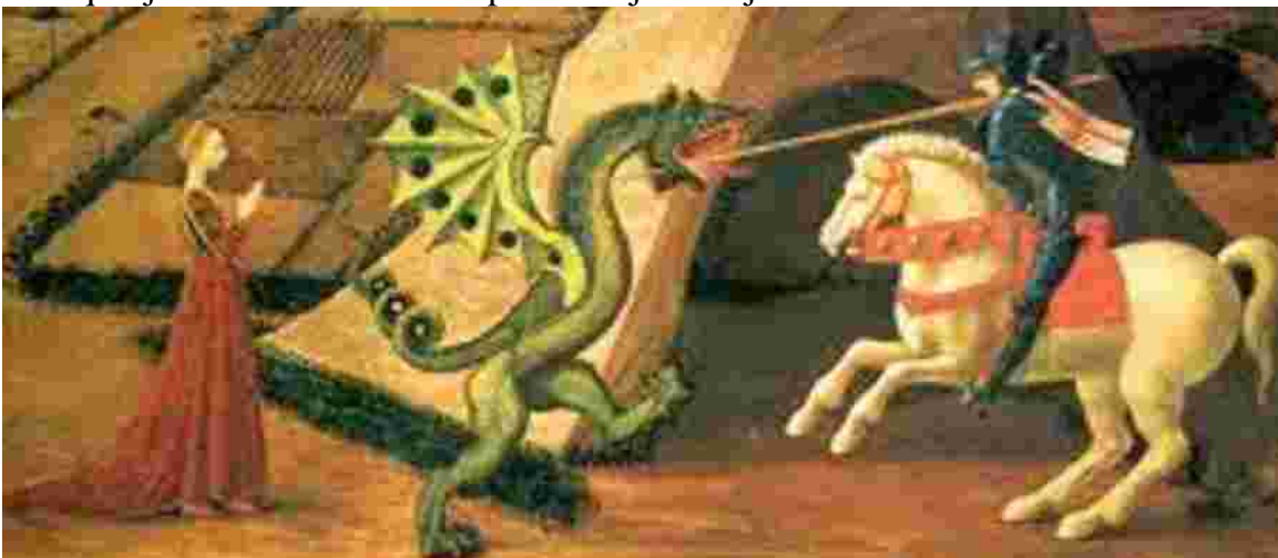
Paolo Uccello 1457 – St-Georges terrassant le Dragon)

Dès que j'ai d'autres liens importants je les ajoute.