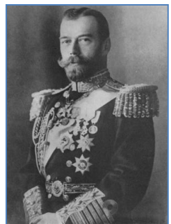
Nikolas II (1868-1918), Tsar Rusia 1894-1917)