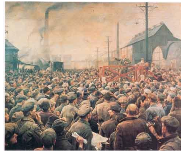
Lenin é salmenniñ ar vicherourien en uzinoù Poutilov, Nevez-hañv 1918. Taolenn saac Brodski (1884-1939)