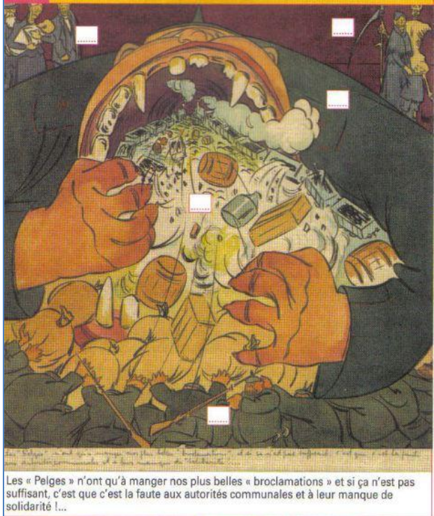
Diell 7: rekizadurioù alaman e Bro Velgia dalc'het (flemmskeudenn belgiad 1917)