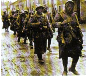
Diell 5: tennaerien a vro Senegal é tistroiñ a Verdun e 1917