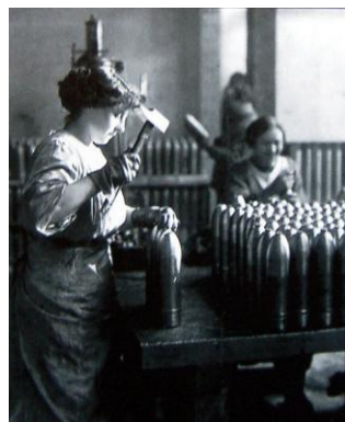
Diell 2: Ar « munitionnettes » é sevel obuzioù en uzin Renault: ar vaouezed o deus produet e-pad 4 blez 300 million a obuzioù ha 6 miliard a gartouchennoù