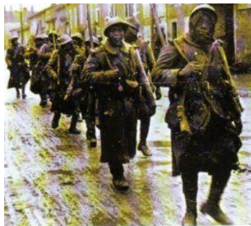
Diell 5: tennaerien a vro Senegal é tistroiñ a Verdun e 1917