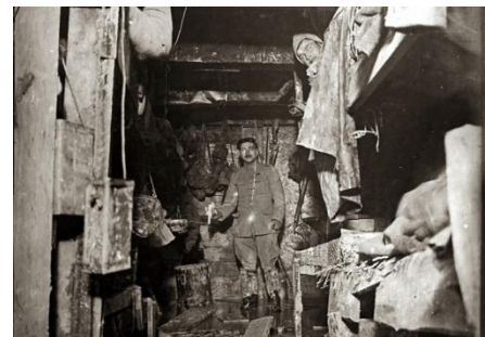
Diell 8: Cagna pe goudor

Diell 7: Testeni ur poilu dianv Le corps est soumis aux pires agressions, brûlures, engelures, fluxions de poitrine, plaies purulentes. Sans compter le cortège de poux, de puces, de mouches et de vermine. Des effluves de vinaigre et de pétrole (seuls boucliers face à ces sales bestioles) rendent nauséabonde l'atmosphère des abris. A cela s'ajoutent les odeurs d'urine, de transpiration et de cadavres en putréfaction. Un jardin d'Eden pour les rats qui infestent les refuges en hordes velues. Je passe des nuits terribles, recouvert totalement par mes couvre-pieds et ma capote, je sens pourtant ces bêtes immondes qui me labourent le corps. Ils sont parfois quinze à vingt sur chacun de nous, et après avoir tout mangé, pain, beurre et chocolat, ils s'en prennent à nos vêtements.