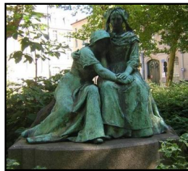
Diell 5: Delwenn e Nancy anvet « Le souvenir » pe "La Lorraine pleurant sur l'épaule de l'Alsace"