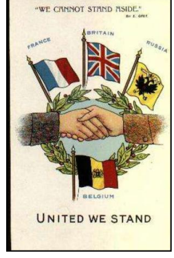
Diell 7: an aliañsoù etre ar Stadoù e 1912