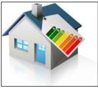
JO d'ar 15 a viz Mae 2007