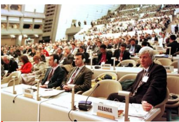
Protokol Kyoto àr an diorren padus