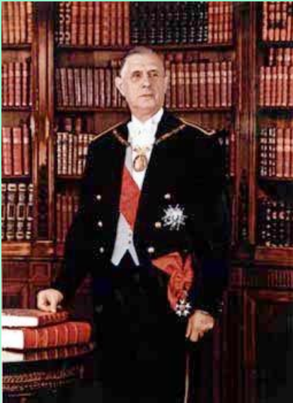
Charles de Gaulle 1958-1969