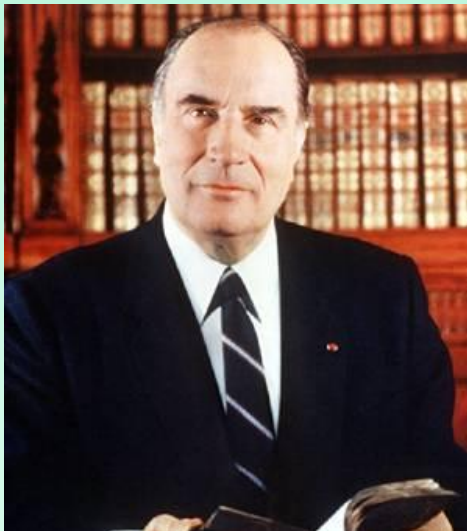
François Mitterrand 1981-1995

http://societe.photos.fluctuat.net/Photos-officielles-les-presidents-de-la-republique-alb248-1.html