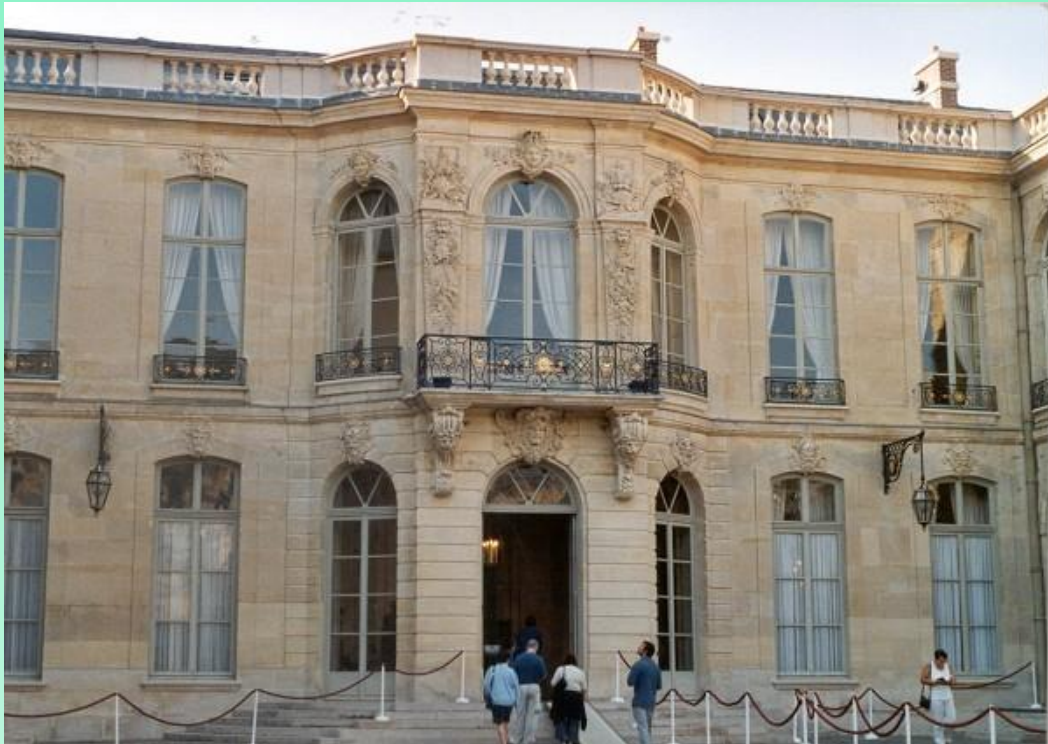
Hôtel Matignon, sez ar C'hentañ Ministr