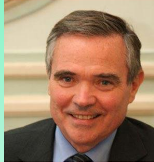
Bernard Accoyer, prezidant ar Vodadenn Vroadel abaoe 2007

Hantergelc'h e lec'h e vez an tabutoù meur ha goulennoù d'ar gouarnamant