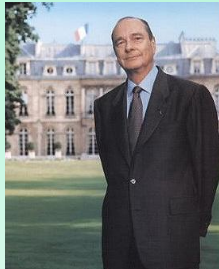
Jacques Chirac 1995- 2007