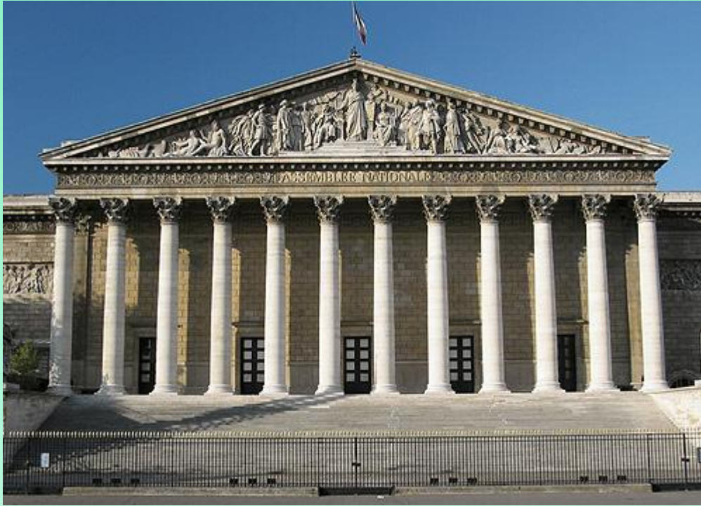
Talbenn Palez Bourbon e-tal plasenn ar C'honkord

Hantergelc'h e lec'h e vez an tabutoù meur ha goulennoù d'ar gouarnamant