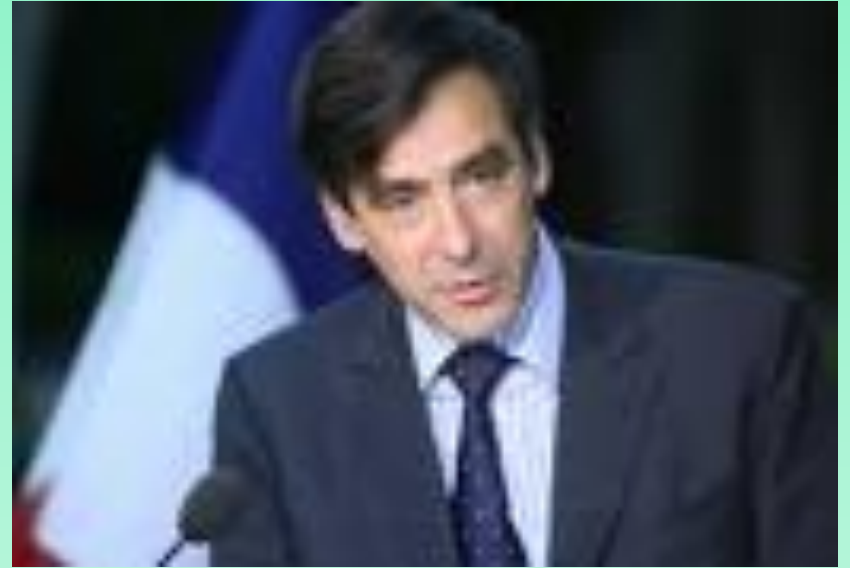
François Fillon, kentañ ministr