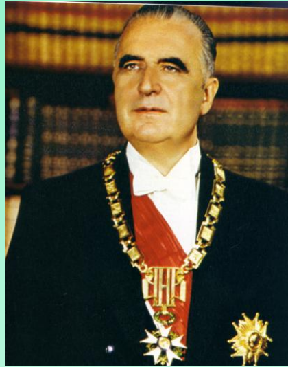
Georges Pompidou 1969-1974