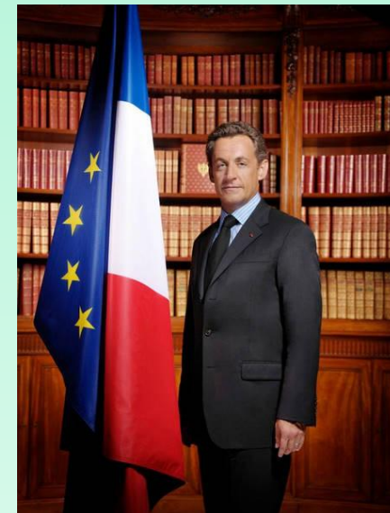
Nicolas Sarkozy 2007- ?