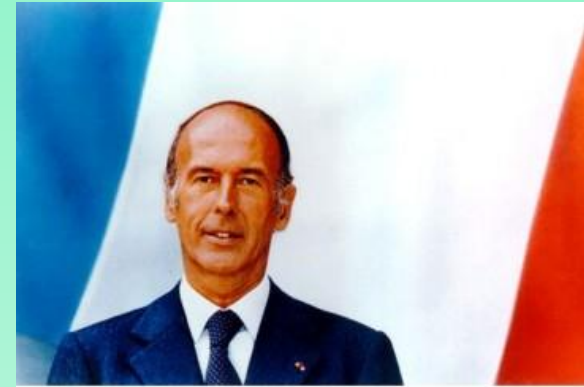
Valéry Giscard d'Estaing 1974-1981

http://societe.photos.fluctuat.net/Photos-officielles-les-presidents-de-la-republique-alb248-1.html