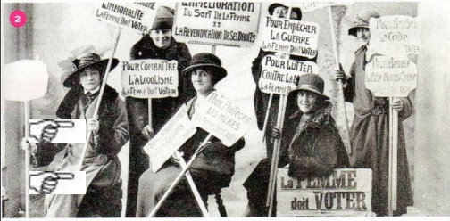
Première moitié du XX e siècle Les suffragettes (nom issu du mot « suffrage ») revendiquent le droit de vote et l'égalité hommes/femmes. Place de la Bastille à Paris en 1935

10. Petra a ra ar “suffragettes” evit kaout ar gwir votiñ?