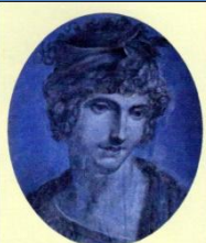
Olympe de Gouges (1748-1793), Déclaration des droits de la femme, 1791.

« Article 1. La femme naît libre et demeure égale à l'homme en droits. Article 3. Le principe de toute souveraineté réside essentiellement dans la Nation qui n'est que la réunion de la Femme et de l'Homme. Article 10. La femme a le droit de monter sur l'échafaud, elle doit avoir également celui de monter à la tribune. »