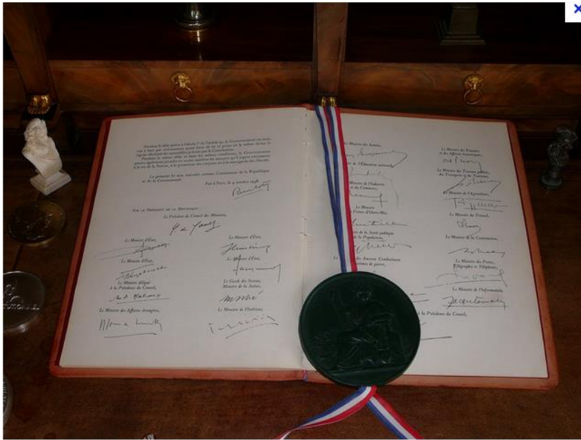
Bonreizh ar Vvet Republik, 1958