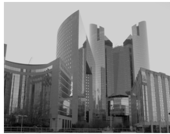
Vue de la Défense (Île-de-France)