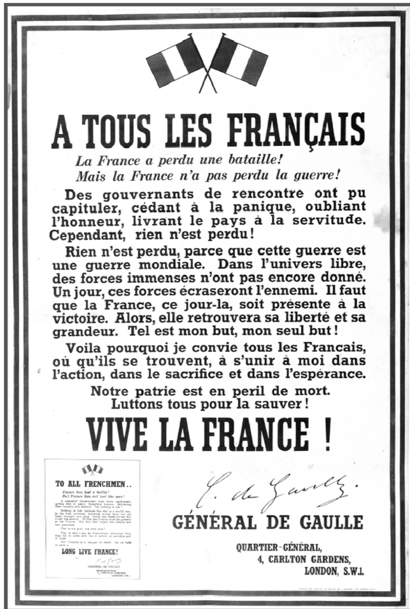
Source : L'histoire par l'image. Affiche publiée en juillet 1940. © Paris - Musée de l'Armée, Dist. RMN-Grand Palais/Pascal Segrette.

1. Nommez l'auteur du message délivré par cette affiche.