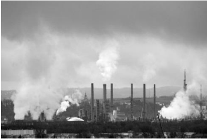
Vue du site de Feyzin (vallée du Rhône)

3. Reliez chacune des photographies à l'espace auquel elle correspond. (1,5 point)