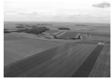
Vue des plaines de la Beauce (Bassin parisien)