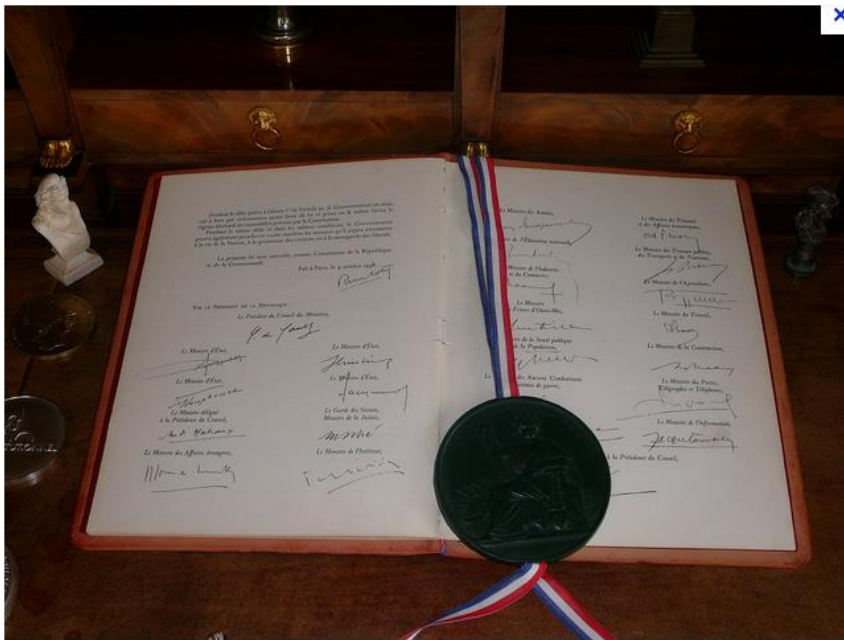
Bonreizh ar Vvet Republik, 1958