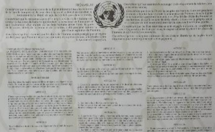
Disklêriadur hollvedel gwirioù mab-den, 1948