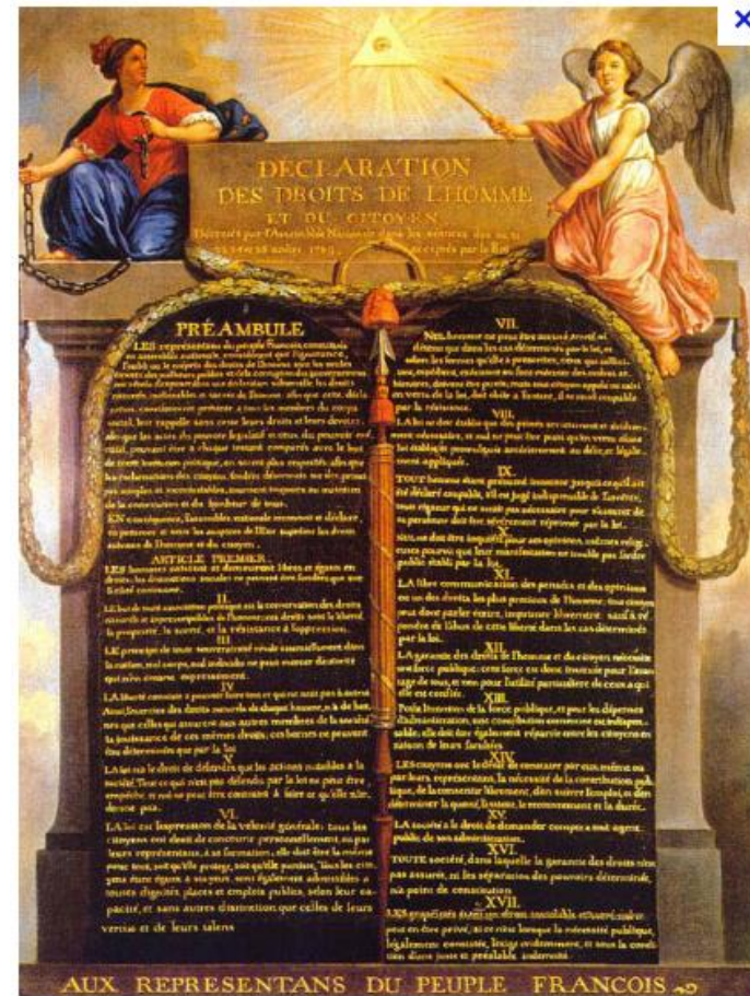
Disklêriadur gwirioù mab-den hag ar C'headedad East 1789