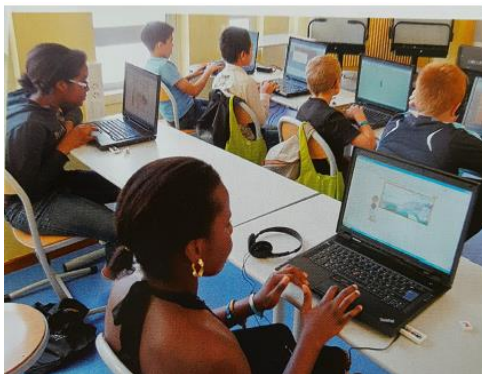
Diell 1 a