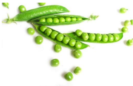
DES PETITS POIS