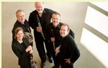
Les musiciens du Quintette à vent de la Philharmonie de Berlin

Élèves du Conservatoire Darius Milhaud : Gratuit