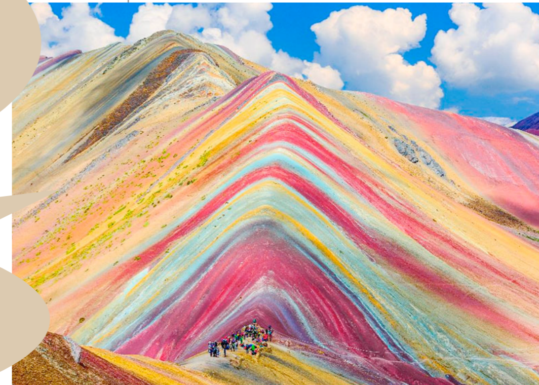
La montaña de los 7 colores