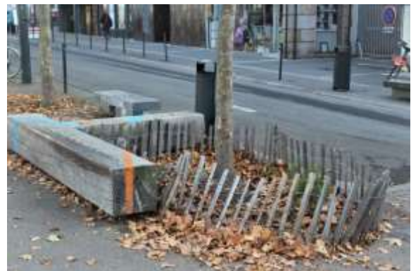
Les bordures encadrant la végétation