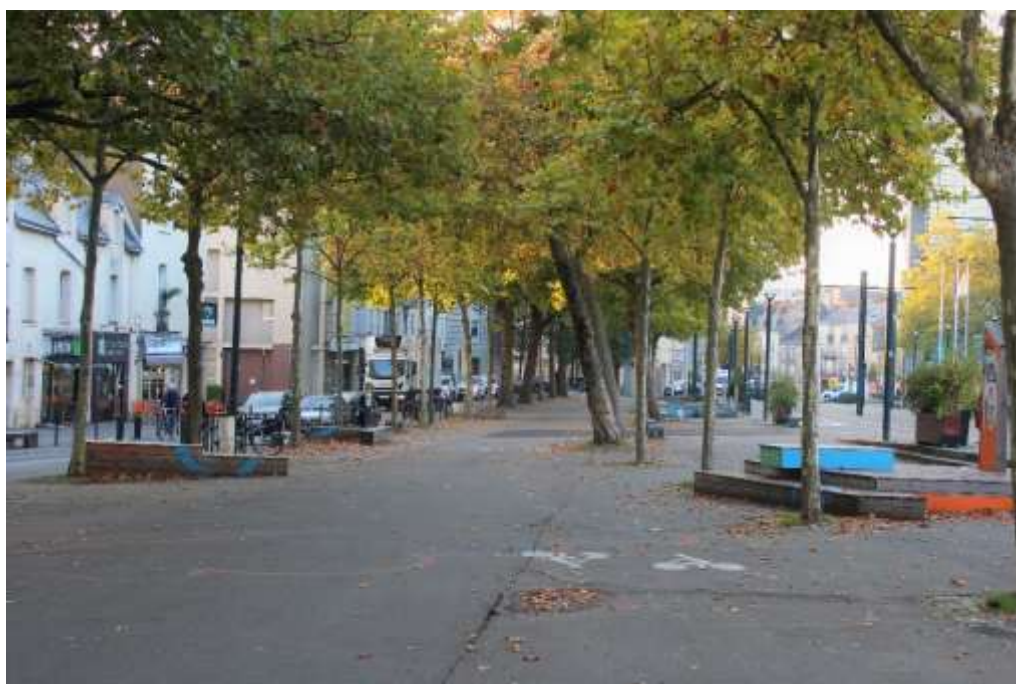
Place Viarme- Nantes

L'étape suivante permettra de mettre en œuvre les savoir-faire de chaque filière : ainsi, les agenceurs (filière ERA) composeront les plans définitifs d'agencement et finaliseront la conception sur plan du projet retenu. Les menuisiers agenceurs et les élèves de la filière métallerie démarreront alors la fabrication du mobilier urbain (salons urbains, terrasse et boulodrome).