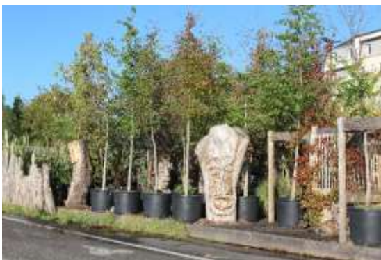
Quai des plantes