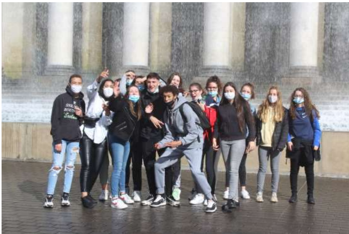
Le groupe 1ERA devant le rideau d'eau -Graslin (Nantes)

Quelques croquis. Source d'inspiration : le VAN