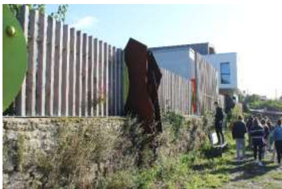
Jardin des Oblates (Chantenay-Nantes)