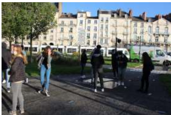
Mémorial de l'abolition de l'esclavage

Photos, recherches personnelles, croquis... Les élèves ont rendu compte de leurs découvertes.