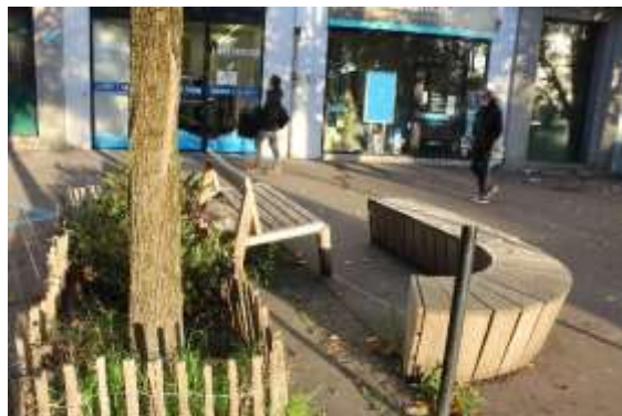
Exemple de salon urbain à remplacer