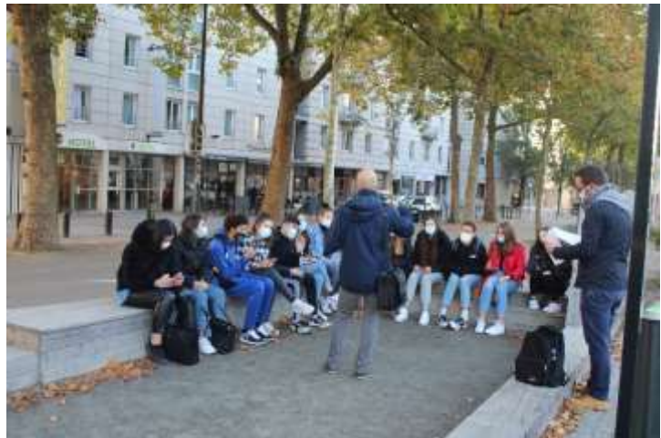
Rendez-vous « professionnel » - 16 octobre 2020