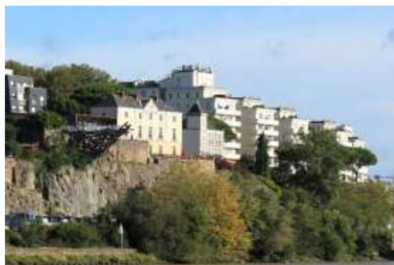
Le Belvédère de l'Hermitage- (Chantenay – Nantes)