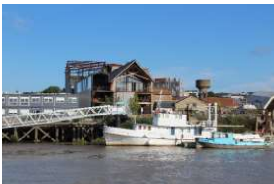
Le LAB (Little Atlantique Brewery) Bas Chantenay