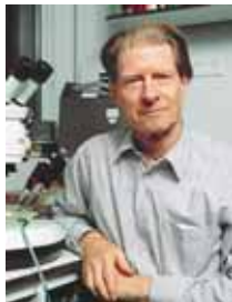
John Gurdon Université de Cambridge, RU

Le prix Albert Lasker 2009 pour la recherche médicale fondamentale a été attribué à John Gurdon