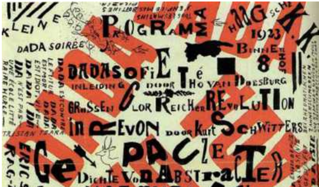
Kurt SCHWITTERS et théo van DOESBURG, Kleine dada soiree (« petite soirée dada »)

En recourant consciemment au hasard, en l'invitant dans l'acte créatif, l'artiste cherche une forme de détachement, de non maîtrise et de spontanéité vis à vis du résultat