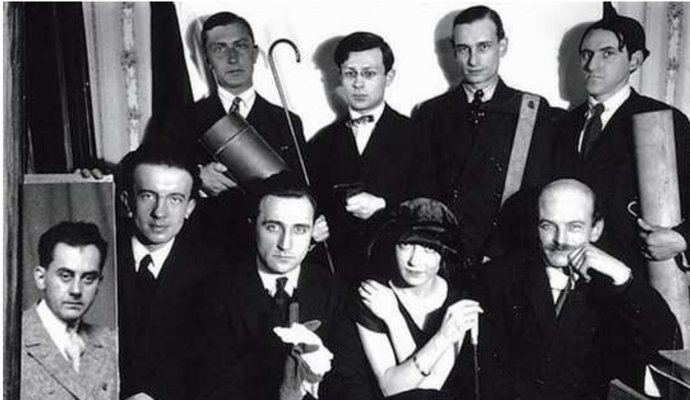
Man Ray, Le groupe dada, vers 1922