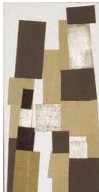
Collage arrangé selon les lois du hasard, 1916