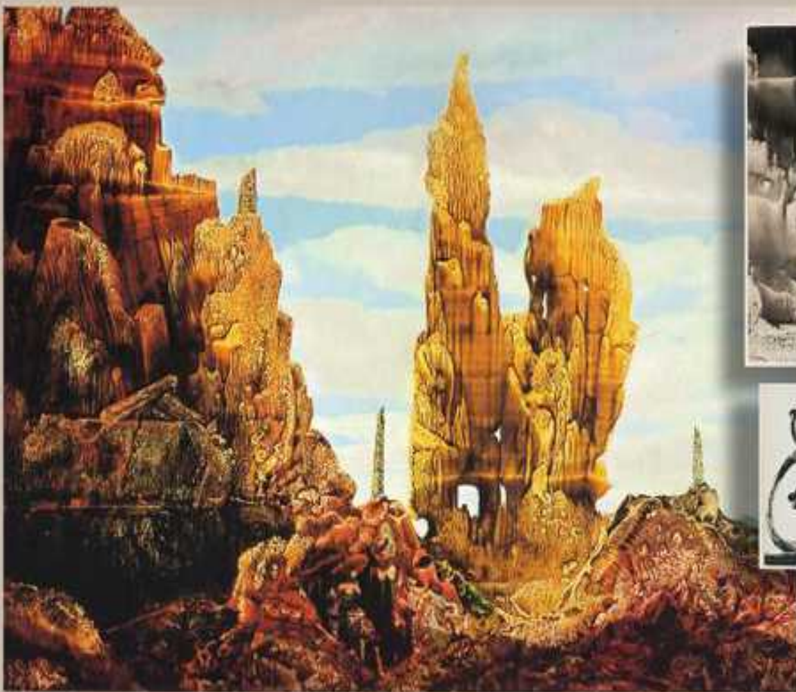
Max Ernst - détail de "L'Europe après la pluie II" 1940 - 1942

L'artiste presse une feuille blanche sur une autre feuille enduite de gouache , et répète l'opération, de manière à reporter plusieurs fois les taches de peinture. L'image qui en résulte permet à l'artiste de libérer son imagination en interprétant à sa guise les formes obtenues et en complétant librement .