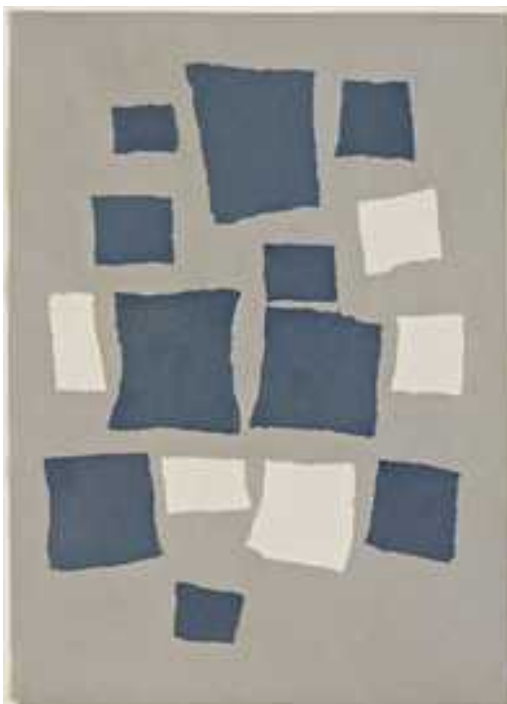
Rectangles selon les lois du hasard, 1916

« L'inspiration ne venait pas ! Il avait déjà commencé plusieurs esquisses qui ne le satisfaisaient pas . Soudain, il se leva, déchira rageusement ses essais et s'en alla boire dans sa cuisine. Quand il revint, calmé, il trouva ses papiers déchirés jonchés au sol. L'illumination s'en suivit. Il trouva que ces papiers tombés au hasard exprimaient mieux ce qu'il voulait dire que tout ce qu'il aurait pu faire ! Il prit donc sa toile et reproduit fidèlement ce qu'il vit au sol. Il recommença de nombreuses fois cette expérience. »