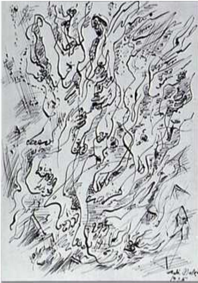
André Masson dessin automatique 1925