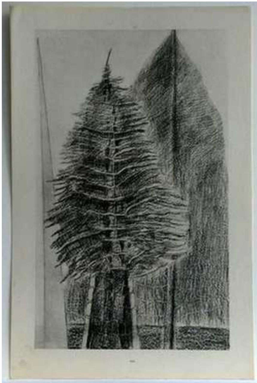
Max Ernst 1924 Histoire naturelle

En réalisant différents frottages de textures ou d'objets différents, imaginez un paysage