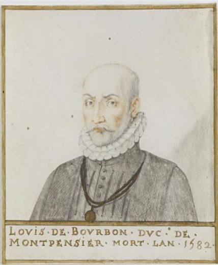
Louis III de Bourbon- Montpensier 1513-1582 57 ans