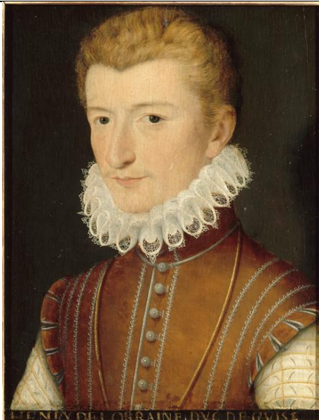
Henri de Lorraine Duc de Guise (Le balaféré) 1550-1588 20 ans Epouse en 1570