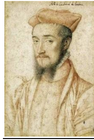
Frères: Charles, Cardinal de Guise, puis de Lorraine (1524-1574)