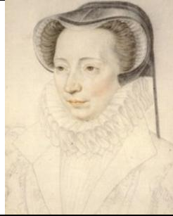
Jacqueline de Longwy 1520-1561 (Première épouse)