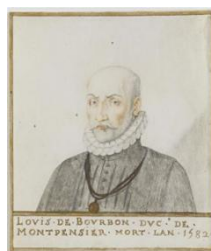
Louis III de Montpensier 1513-1582