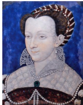
Catherine de Lorraine 1552-1596 18 ans Epouse en 1570: