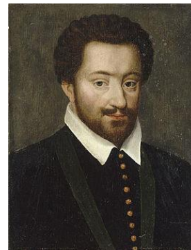
Charles II de Lorraine, duc de Mayenne 16 ans 1554- 1611