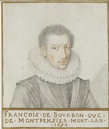
François de Bourbon-Montpensier 1542-1592 28 ans