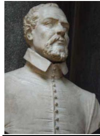
Frères: Claude, duc d'Aumale (1526-1573)