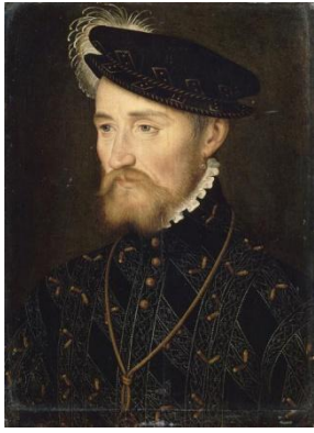
François de Lorraine, duc de Guise 1519-1563 Le balaféré