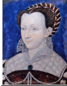
Catherine de Lorraine 1552- 1596 (Deuxième épouse) 18 ans