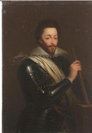
Henri de Bourbon-Montpensier 1573-1608