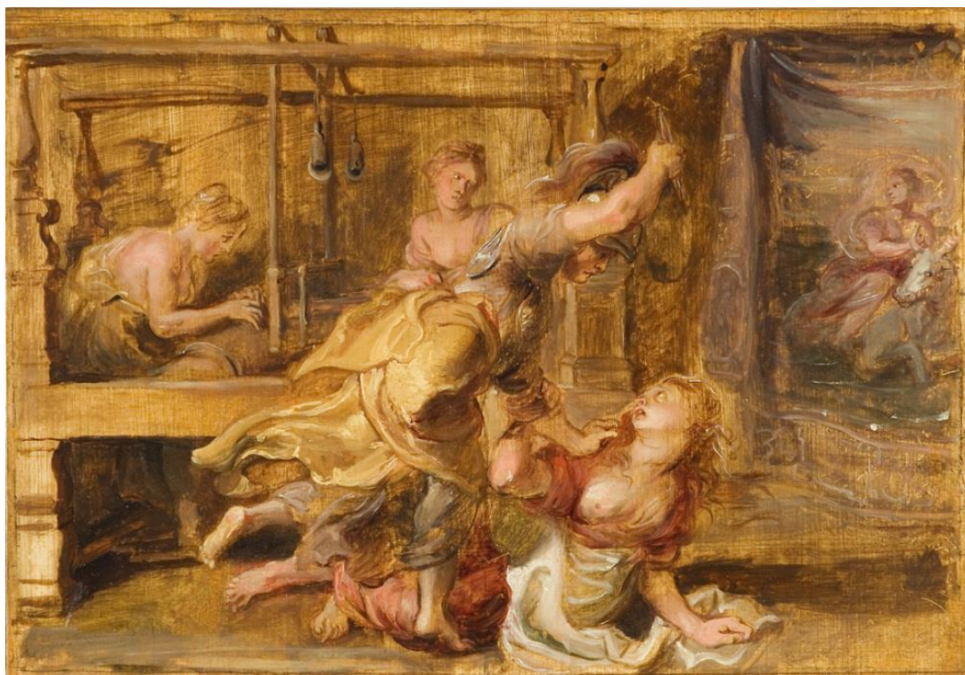
Rubens : Athéna et Arachné (1636) Virginia Museum of fine Arts

Arachné regarda la vieille d'un air farouche, lâcha les fils entamés, et, retenant difficilement sa main, la colère se lisant sur ses traits, elle répondit aussitôt à Pallas qu'elle n'avait pas reconnue : « Pauvre idiotte, tu arrives épuisée par une longue vieillesse, et ton tort est d'avoir vécu trop longtemps. Que ta bru, si elle existe, que ta fille, si tu en as une quelque part, écoutent tes paroles. Il me suffit de prendre conseil de moi-même, et ne va pas te figurer m'avoir aidée de tes conseils, je reste du même avis. Pourquoi la déesse ne vient-elle pas elle-même ? Pourquoi évite-t-elle ce concours ? ».