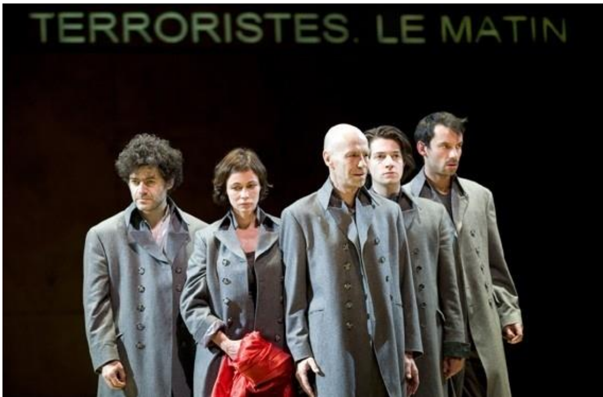
Les Justes, mise en scène Stanislas Nordey, Théâtre de la Colline, 2010

L'intrigue des Justes se déroule en Russie en 1905. Un groupe de révolutionnaires russes a décidé de lancer une bombe contre l'oncle du tsar, le grand-duc Serge et de détruire ainsi un régime despotique et inégalitaire. La question posée est celle de la violence politique, et finalement du terrorisme : a-t-on le droit au nom d'un idéal juste de tuer des innocents ? Le problème se pose dans la pièce au moment où Kaliayev , le personnage principal, celui qui doit lancer la bombe s'aperçoit que dans la calèche du grand-duc, il y a aussi deux enfants, le neveu et la nièce de celui-ci. Il ne parvient pas à lancer la bombe, ce que lui reproche Stépan , un autre révolutionnaire, qui a connu la torture dans les prisons du tsar et qui considère que la fin justifie n'importe quel moyen.