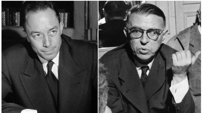
Albert Camus/ Jean-Paul Sartre

Dire que la vie humaine est absurde découle de la négation de Dieu. S'il n'y a pas de Dieu, quel qu'il soit, et si la religion est une invention des hommes pour répondre à des questions qui les dépassent (Qui a créé le monde, pourquoi sommes-nous sur terre?) il n'y a pas d'au-delà, ni « vie » après la mort, ni châtement ni récompense, quels que soient les actes commis. La vie humaine est donc absurde, elle n'a pas de sens préétabli et l'homme est libre de choisir son existence.