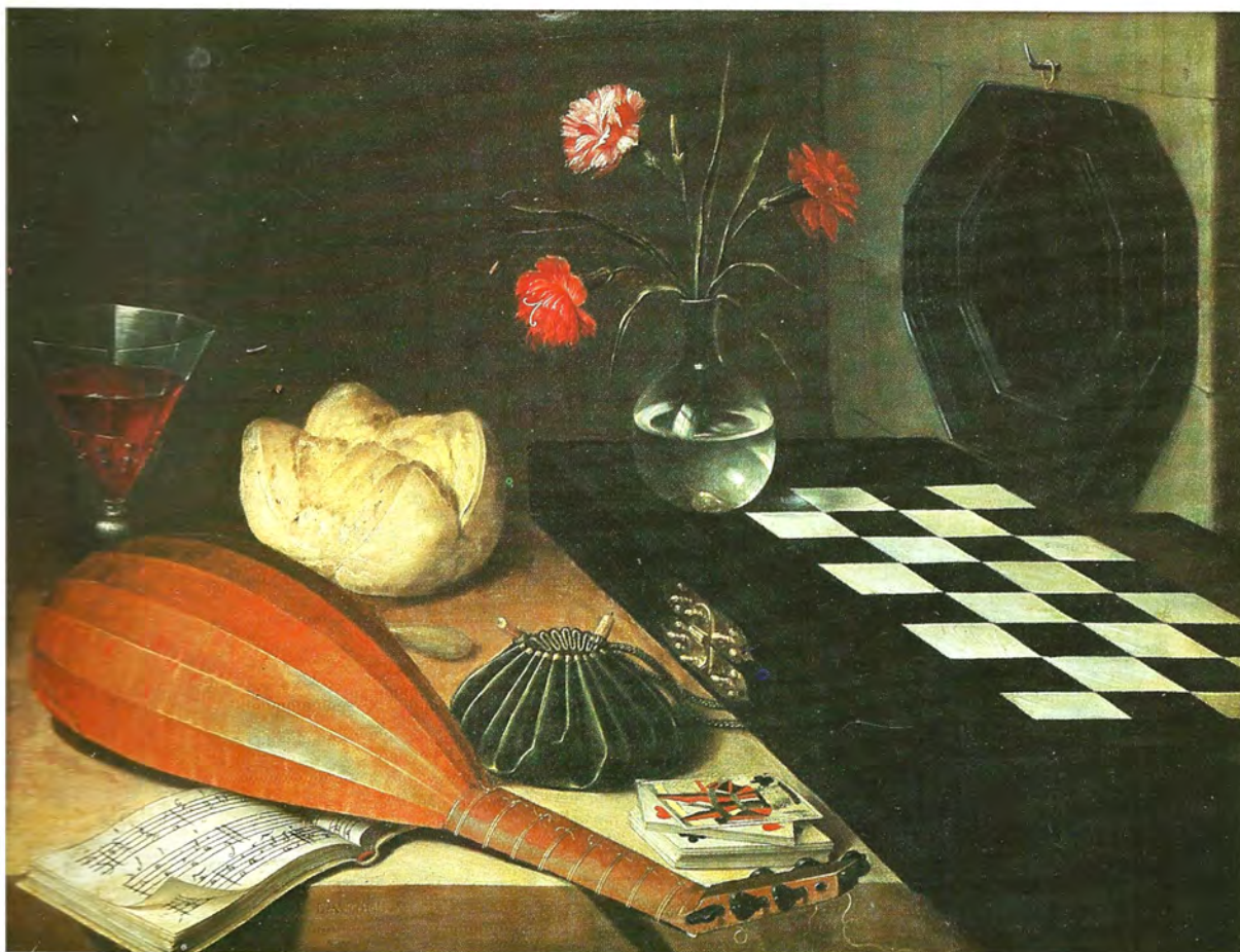
Lubin Baugin Les cinq Sens, 1630 Huile sur bois; 55 x 73 cm Paris, Louvre