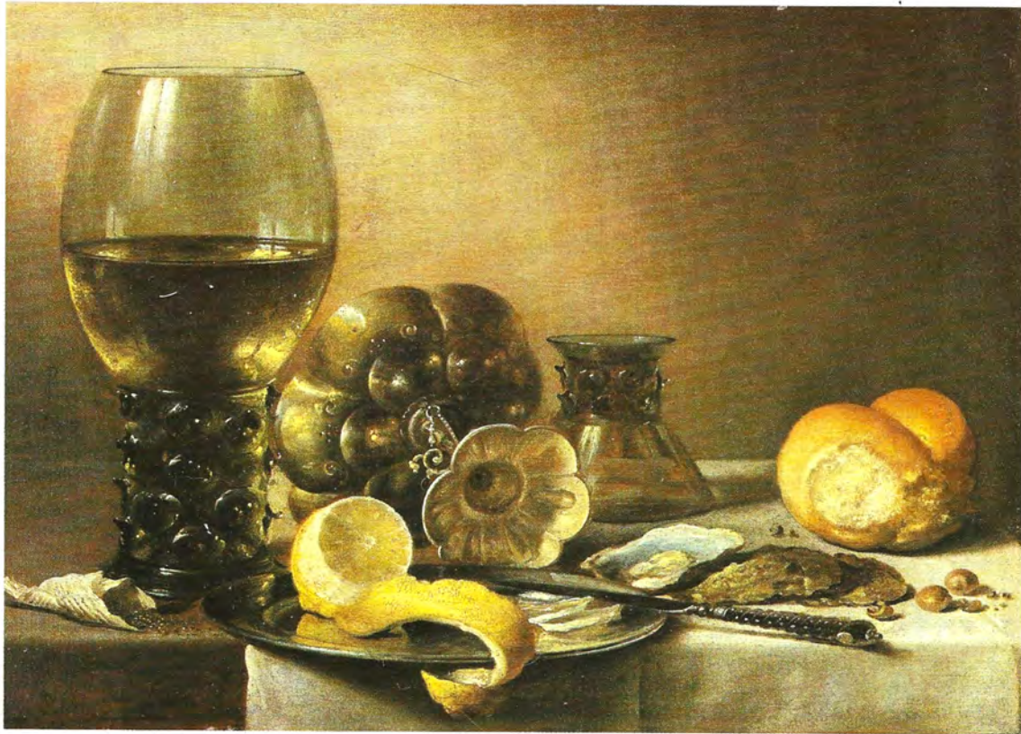
Pieter Claesz Nature morte, 1633 Huile sur bois de chêne; 38 x 53 cm Kassel, Staatliche Kunstsammlungen, Château Wilhelmshöhe