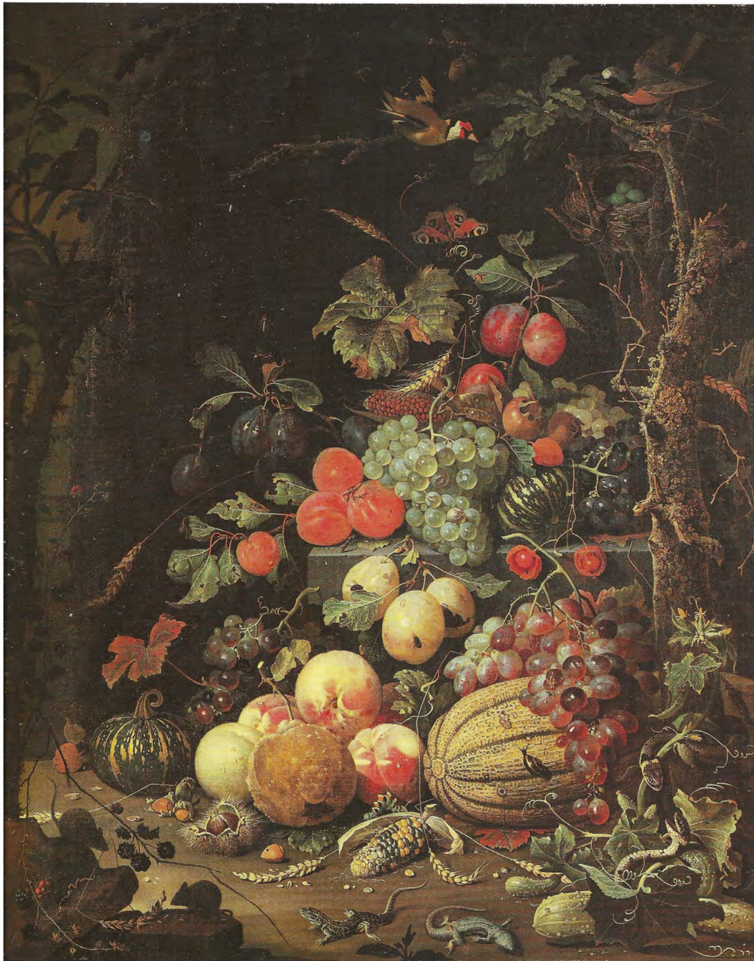
Abraham Mignon (1640-1679) Nature morte, non daté Huile sur toile; 92 x 72,7 cm Cologne, Wallraf-Richartz-Museum