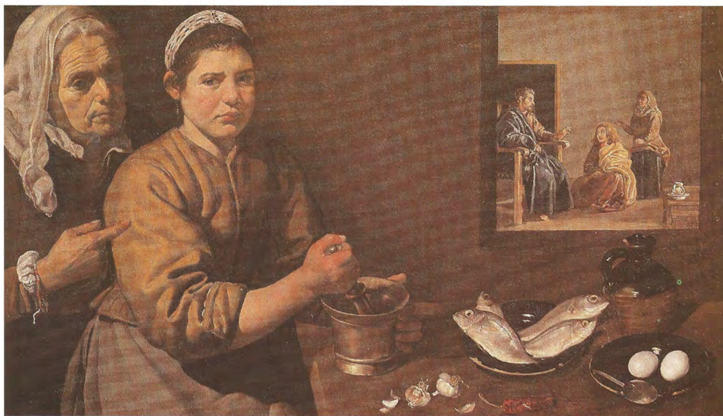
Diego Vélázquez Le Christ dans la maison de Marthe et Marie, 1618 Huile sur toile; 60 x 103,5 cm Londres, National Gallery