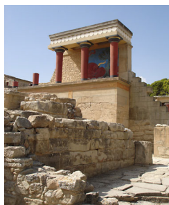
Palais de Cnossos Minoen Moyen Crète, 1900-1350 av. J.-C