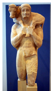
Moscophore, Kouros VIe av. JC Période archaïque