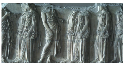
Procession des jeunes filles Frise des Panathénées sculpteur : Phidias Ve av. JC, Période classique