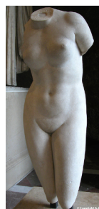
Aphrodite de Cnide d'après un original de Praxitèle IVe av. JC Période classique