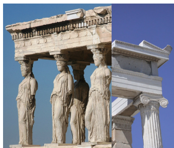
Erechthéon, Acropole d'Athènes, Ordre ionique, fin Ve av. JC Période classique