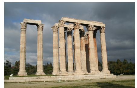
Olympéion, Athènes Ordre corinthien, IIIe av. JC Période Héliénistique