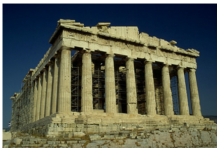
Parthénon, Acropole d'Athènes Ordre dorique, Ve av. JC Période classique