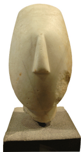
Tête féminine, art Cycladique 2700–2300 av. J.-C.