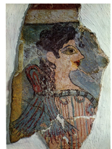
La Parisienne, Cnossos Minoen Moyen entre 1550 et 1450 av. J.-C