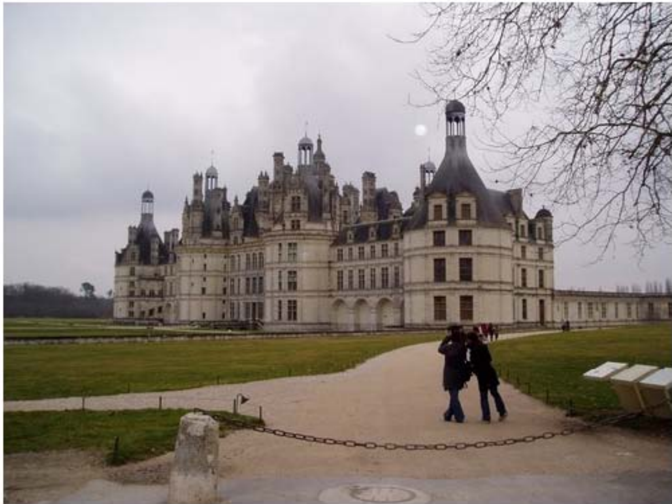
C'est un château de plaisance