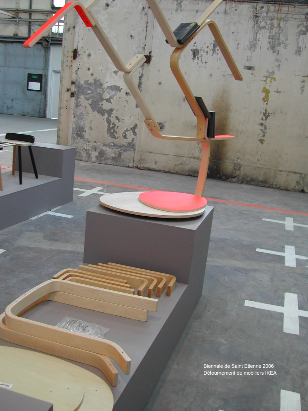
Biennale de Saint Etienne 2006 Détournement de mobiliers IKEA