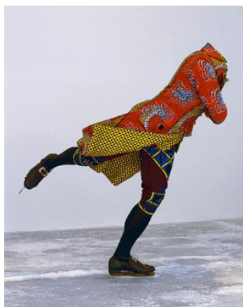
Reverend on Ice, 2005, Yinka Shonibare