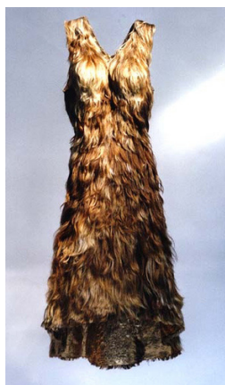
Mona Hatoum Hair dress