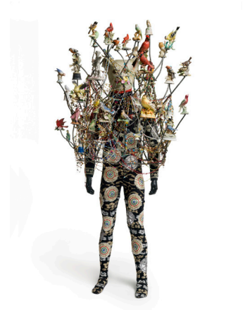
Nick Cave Soundsuit, 2009