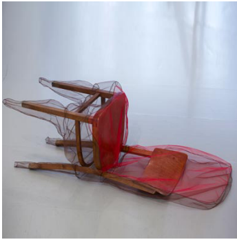
'Caroline Brodhead Throne Down', 2011