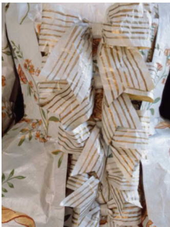
Isabelle de Borchgrave