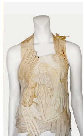
Inspiration Salvador Dalí 1937 Martin Margiela SS II, 2001