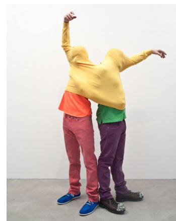
Erwin Wurm, Performative sculpture