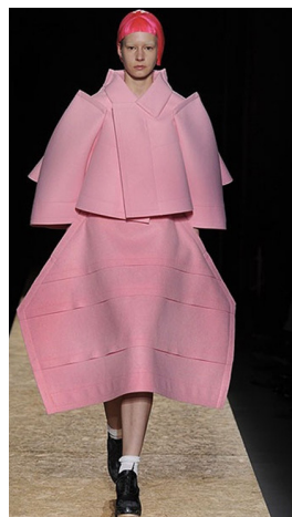
Rei Kawakubo Comme des garçons