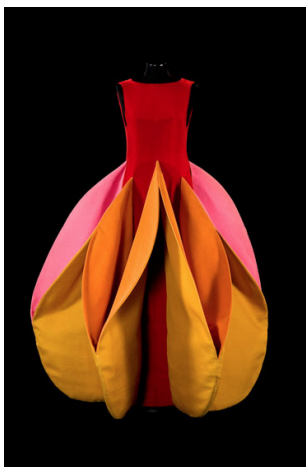
Roberto Cappucci Arancia (Orange) robe de Sculpture, 1982, velours de soie et de gazar de soie