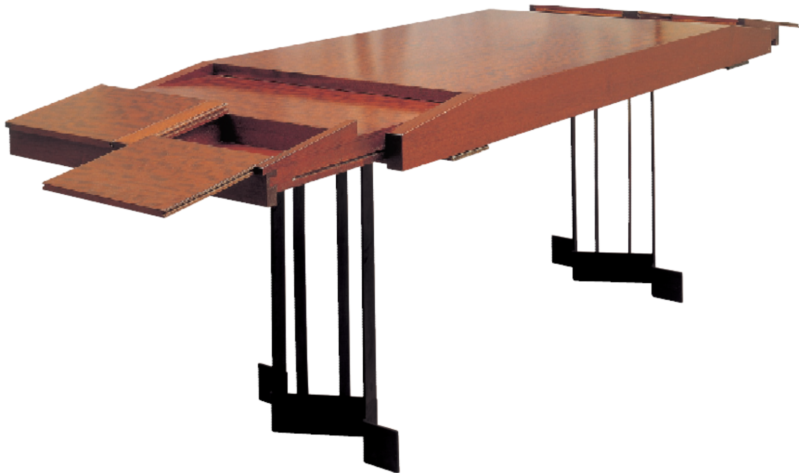
Bureau pour l'architecte Georges Pingusson, 1927, bois et métal