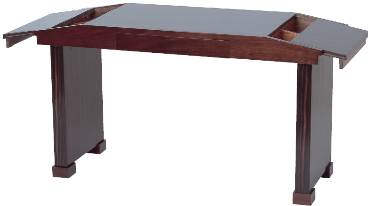
Petit bureau, 1925, palissandre