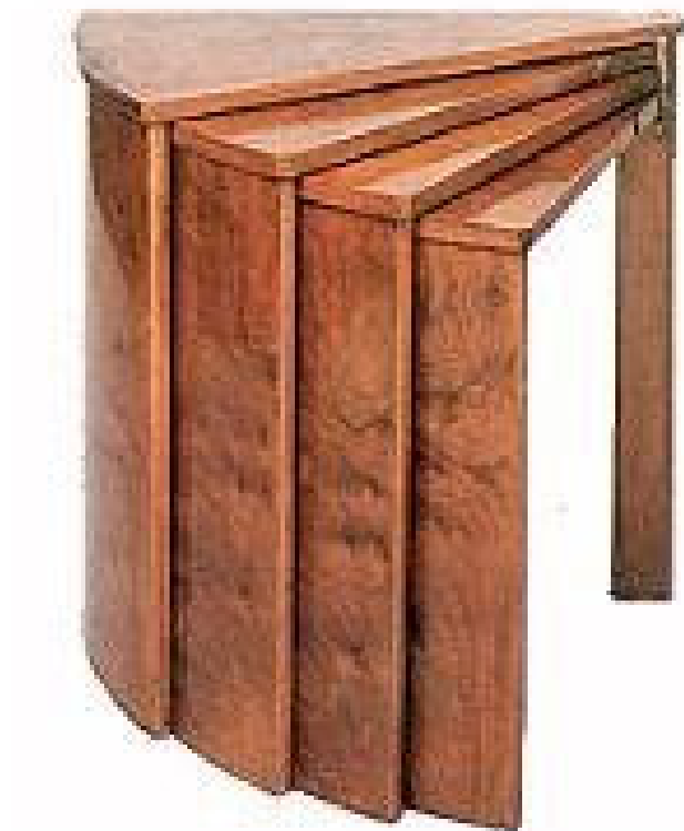
Table gigogne 1924, acajou