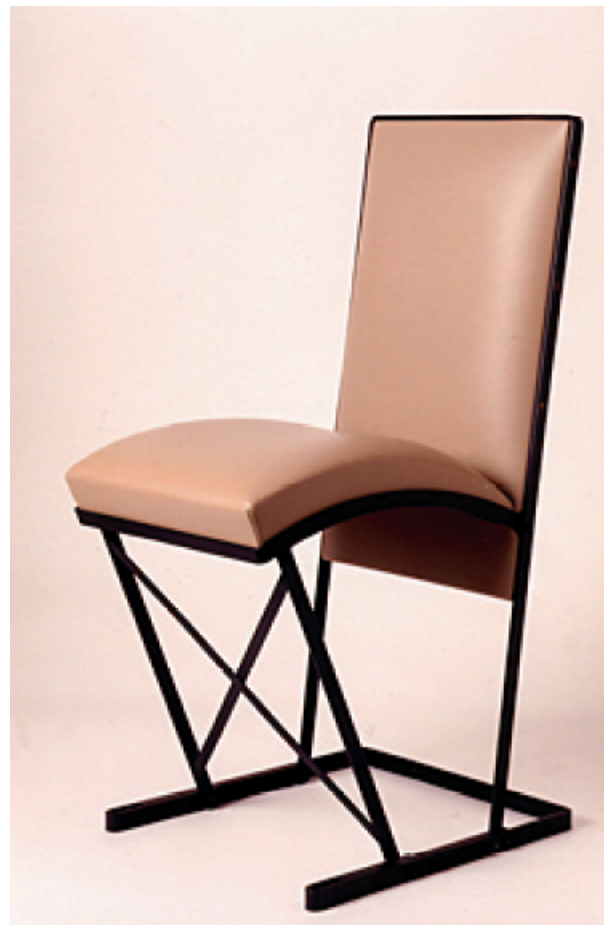
Chaise, 1924 structure métallique noircie