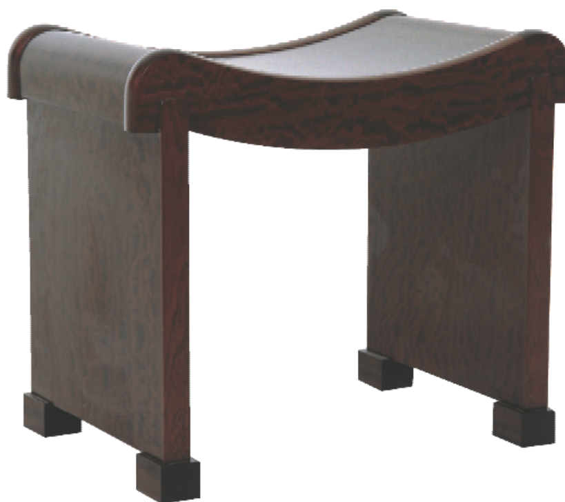
Tabouret curule, 1922, palissandre