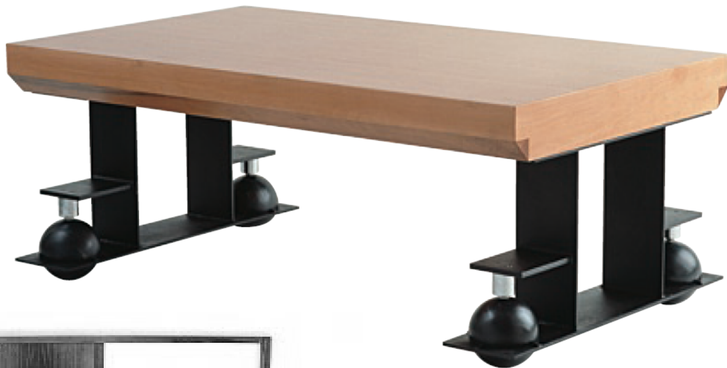
Table, 1927, bois et métal