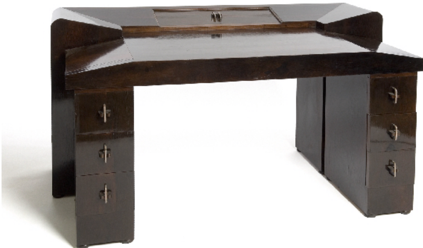
Bureau MB 212, Ambassade, 1925, bois noici