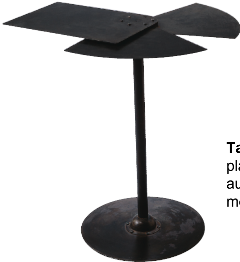
Table éventail SN9 à trois plateaux, l'un fixe, les deux autres pivotants. , 1928, métal oxydé et noirci.