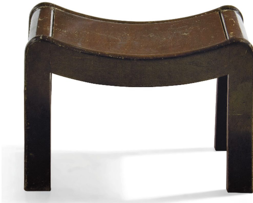
Tabouret SN1 , 1920-21, érable teinté brun