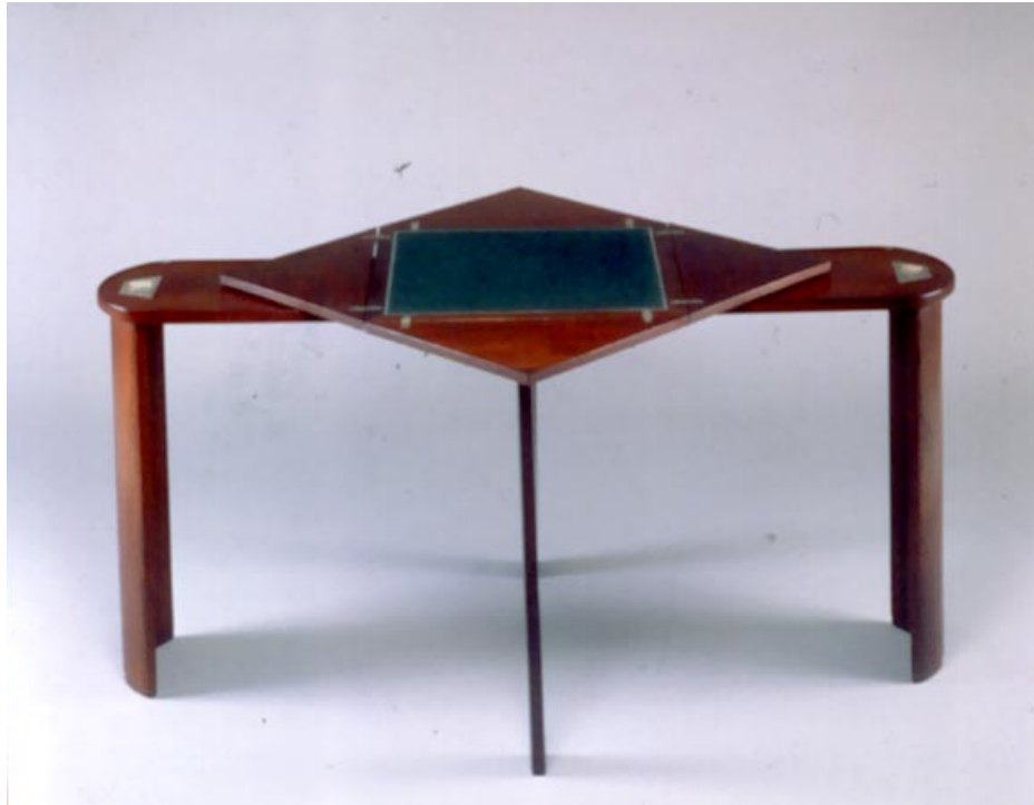
Table de jeu en mouchoir, 1927