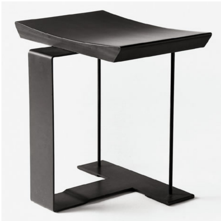
Tabouret, 1927, bois et métal,