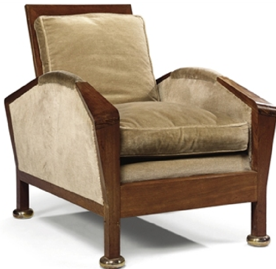
Fauteuil MF220 , 1922, amarante et argent