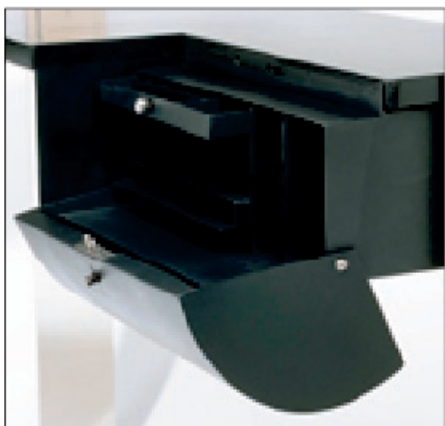
Bureau de Robert Mallet-Stevens dessiné par Pierre Chareau, 1926, chêne massif noirci et métal nickelé avec une tablette, une étagère et un caisson cylindrique en métal noirci