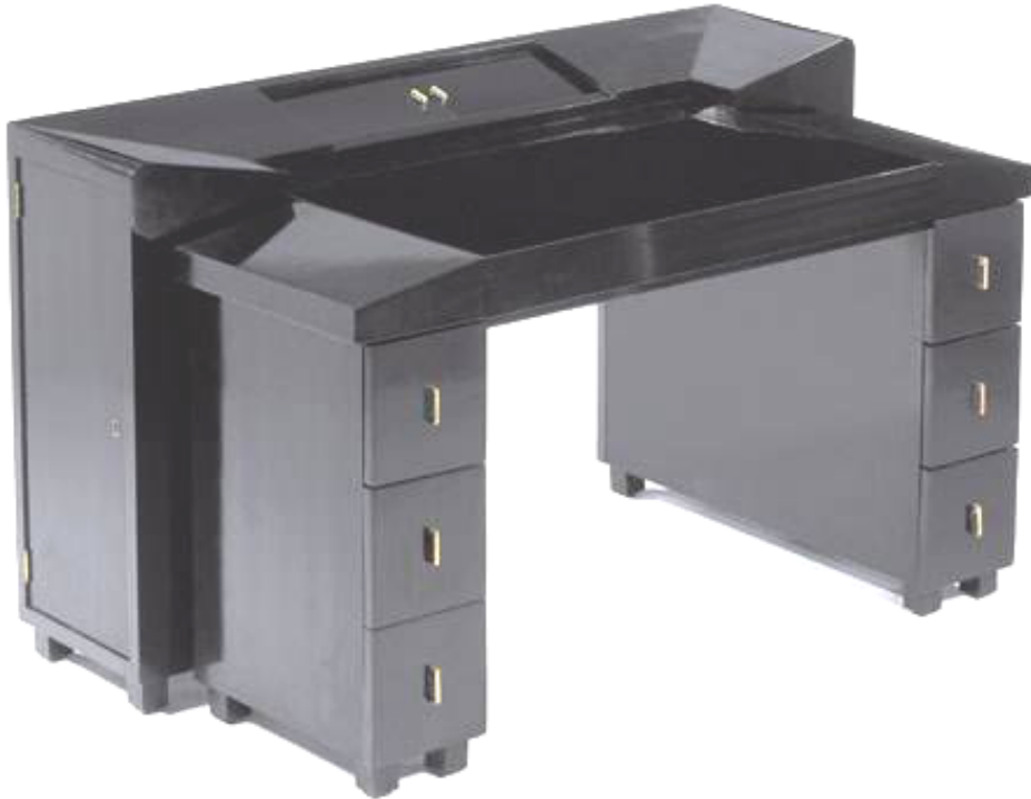
1925 bureau "MB212", bois noirci

Sur un format A4, vous ferez un croquis de chacun des meubles suivants. Vous direz si ces meubles, sont de style Art Déco ou moderne et par des annotations vous expliquerez pourquoi ?