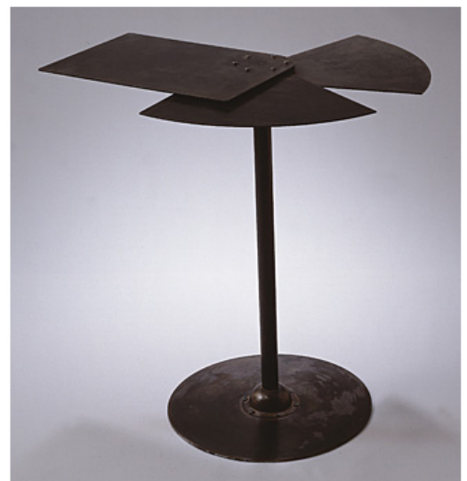
1928 table éventail métal

- Style moderne : formes géométriques, matériaux industriels (Table éventail).