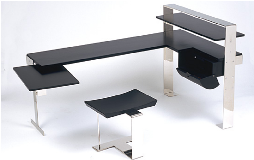
1926 , bureau et tabouret - bois et métal