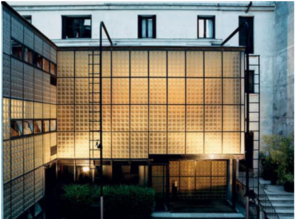
Façade avec l'éclairage extérieur

Pierre Chareau réalise en 1928-1931, 31, rue Saint Guillaume à Paris, pour le docteur Dalsace, son œuvre majeure, la Maison de Verre composée de trois étages.