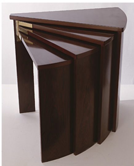
1924 tables gigognes acajou

Le mobilier de Pierre Chareau est - Art Déco formes géométriques, matériaux traditionnels (Table gigogne) ;