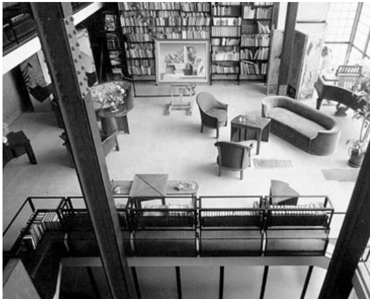
Vue du salon, à gauche

Ci-dessous, la salle d'attente du docteur et l'escalier montant à la partie privée de la maison.