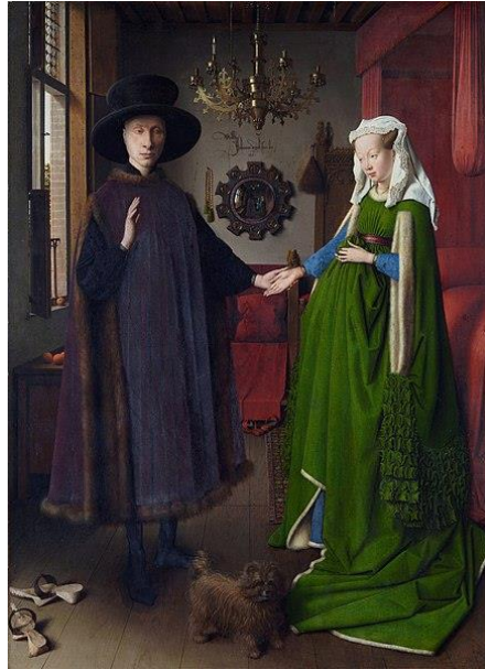
(« Les époux Arnolfini » - Johannes van Eyck 1390-1441)