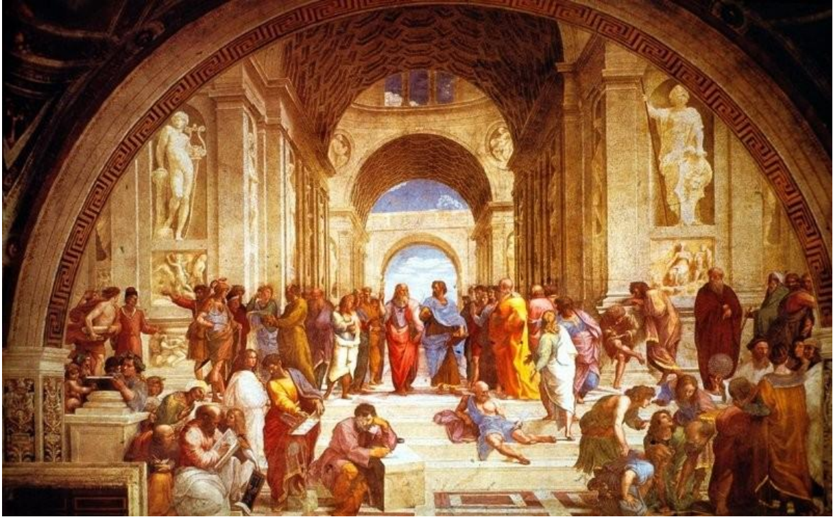
(« L'École d'Athènes » - 1509/1510 - Raphaël 1483-1520)