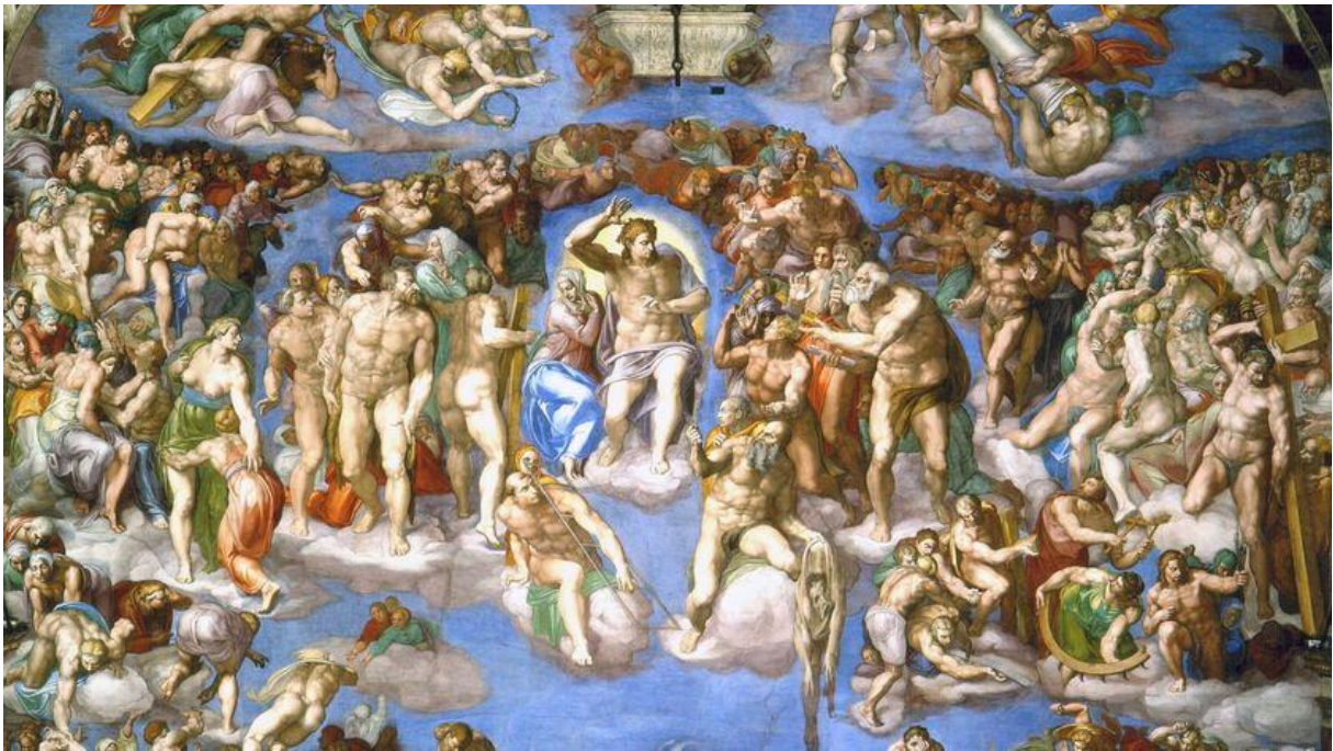
(« Le Jugement dernier » - Entre 1536 et 1541 – Michel-Ange 1475-1564 – Rome, Vatican, Chapelle Sixtine)