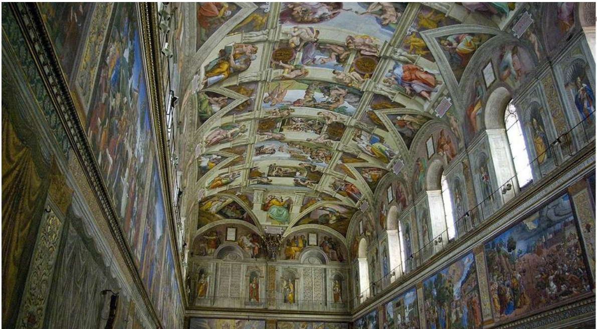
(La Chapelle Sixtine – Vatican, Rome – Fresques de Michel-Ange)