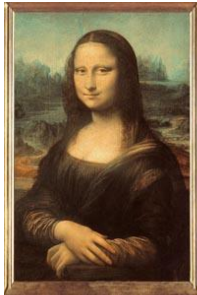
(« La Joconde » ou « Portait de Mona Lisa » 1513/1516 – Musée du Louvre, Paris)