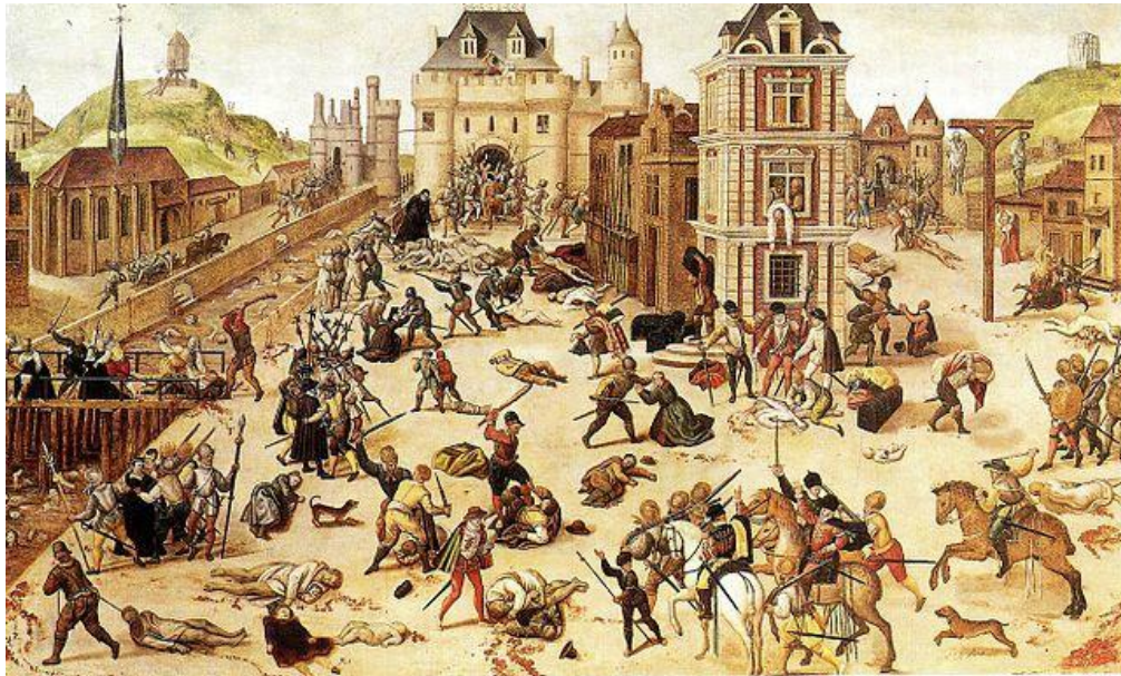
(24 août 1572 - Le massacre de la Saint-Barthélemy par François Dubois (1529-1584) - Musée cantonal des Beaux-Arts Lausanne - 94 × 154 cm)