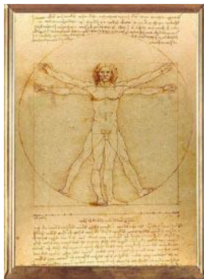
(« Homme de Vitruve » ou « Proporzioni del corpo umano secondo Vitruvio » - Dessin vers 1490 – Gallerie dell'Accademia, Venise)