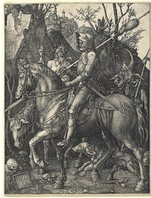
(« Le Chevalier, la Mort et le Diable » - 1513 - Staatliche Kunsthalle Karlsruhe)