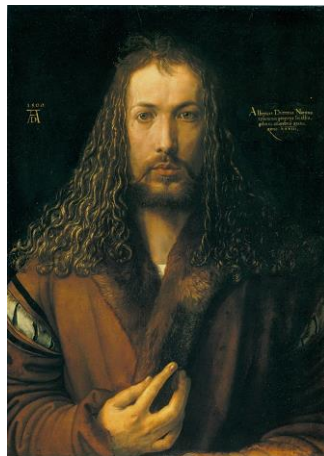
(« Autoportrait à la fourrure », 1500 - Munich, Alte Pinakothek)