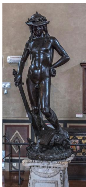
(Donatello, « David » - Sculpture Bronze doré – 1440 - Musée du Bargello, Florence)