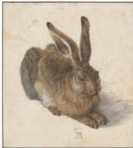
(« Feldhase » / « Le lièvre » - aquarelle et gouache 1502 - Graphische Sammlung Albertina, Vienne)