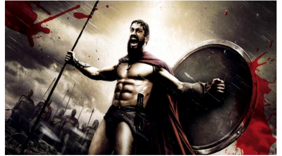
Léonidas, dans le film 300, d'après la BD de Frank Miller

Cette expression est utilisée pour décrire un certain idéal de l'être humain, qui associe l'apparence physique (le beau καλὸς) et, l'attitude intérieure et morale (le bon ἀγαθός). Un héros comme Léonidas, physiquement fort et moralement courageux, est l'exemple même du καλὸς κάγαθός.