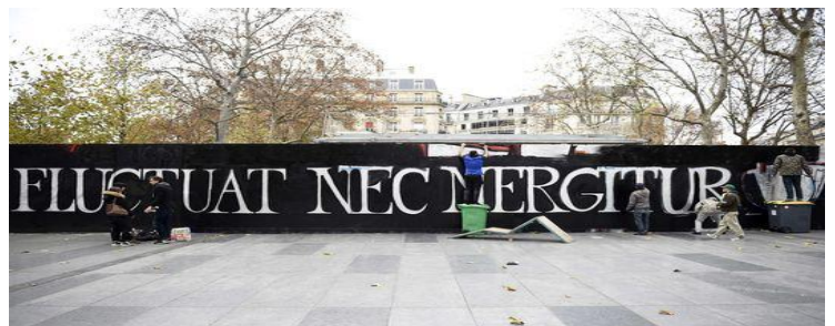
Banderole réalisée après les attentats de Paris en novembre 2015

C'est la devise de Paris. La métaphore du bateau malmené par les tempêtes mais qui ne coule pas évoque la résistance de la ville de Paris aux adversités de tous temps.