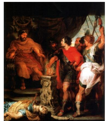
Mucius Scaevola devant Porsenna. de Pierre Paul Rubens.

Caius Mucius Scaevola est l'exemple même du héros qui, fier d'être citoyen romain, sacrifie sa propre personne au service de sa patrie.