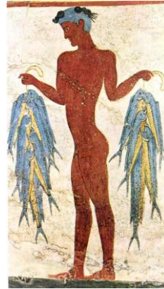
.....à Akrotiri , ville grecque d'époque minoenne. env.2000- 1500 av JC