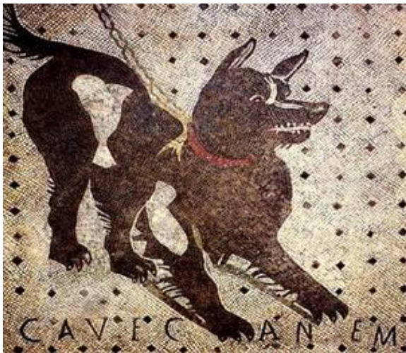
« Cave canem », mosaïque provenant de la maison du poète tragique à Pompéi

En plus, mes collègues se sont bien moqués de moi. Mais moi, une fois revenu de ma frayeur, je n'ai cessé de détailler tout le mur