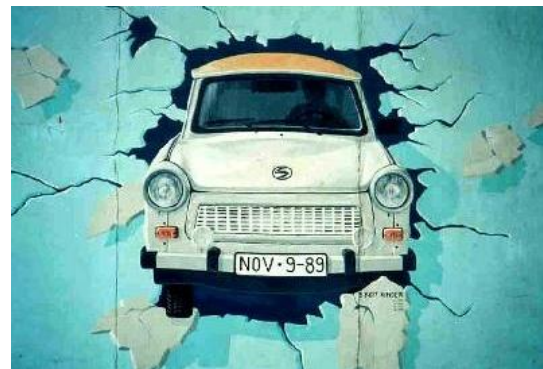
Peinture d'une Trabant passant le..... East Side Gallery,1990

Les Romains donnent à cet art beaucoup de raffinement. Les plus belles fresques romaines ont été découvertes à Pompéi