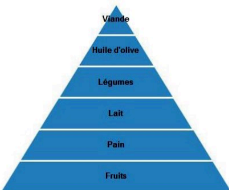
Pyramide alimentaire du régime crétois des années 60

cherchez le sens du mot épidémiologique et mono factorielles