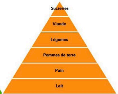
Pyramide alimentaire du régime finlandais des années 60