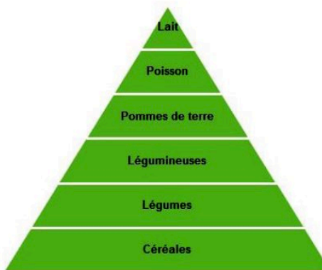
Pyramide alimentaire du régime japonais des années 60