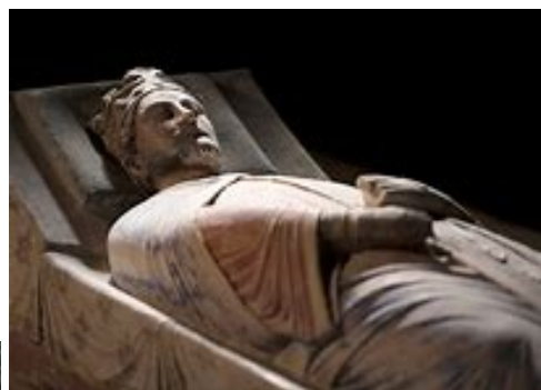
La mort de richard cœur de lion. 1199