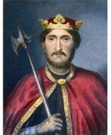
Richard II qui est le premier à prendre le titre du Duc de Normandie. 996