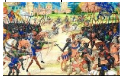
fin de la guerre de cents. 1453