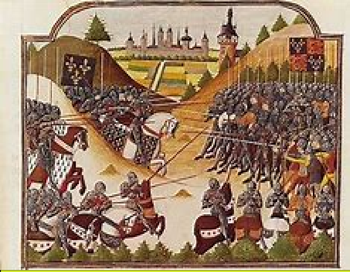
Dernière bataille contre les anglais à Formigny. 1450

une période qui s'appelle anarchie. 1135 à 1153