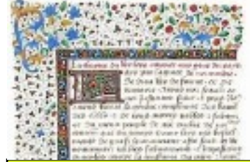
Chartes aux normands (une charte qui donne le droit de justice). 1315