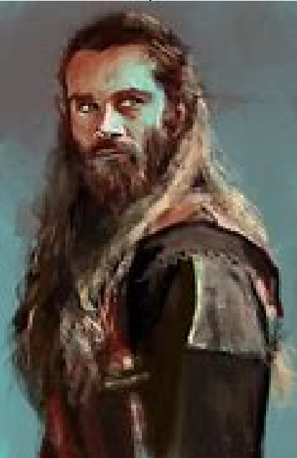
Les vikings reviennent et pie paris, le roi de France cherche une solution et donc donne le territoire et leur donne des missions a faire au chef des vikings (Rollons), qui sont de l'administrer et de la protéger. 885