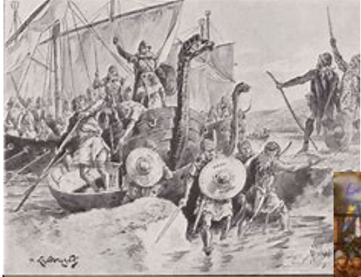
Premier raid viking dans la seine. 841