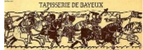
Conquête de l'Angleterre par Guillaume le Conquérant. 1006