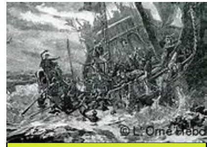
Naufrage de la Blanche nef 1120