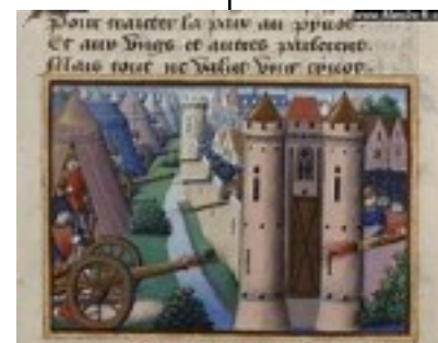
Dans la guerre de cents ans. Prise de Rouen par les anglais. 1419