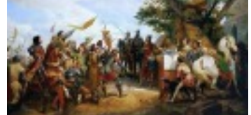
La Normandie est retourner dans les mains des français. 1204