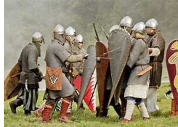
Bataille de Tinchebray ( dans l'Orme ). 1106