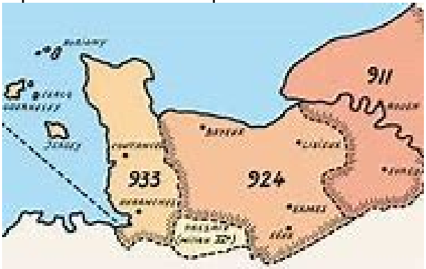
Acquisition des derniers territoires normands. Le Cotentin au nord et de l'Avranchin au sud et des autres territoires normands. 933