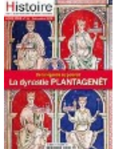
Le début de la dynastie des Plantagenet et Henry II. 1154