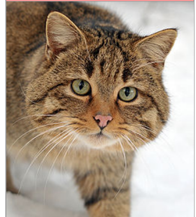
Felis silvestris silvestris