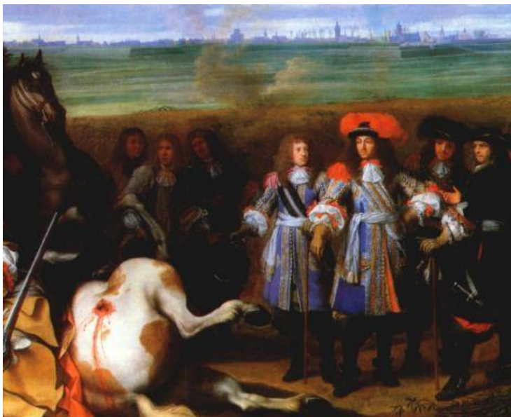
Louis XIV visitant une tranchée pendant la guerre de Dévolution (1667-1668)