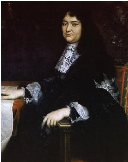
François-Michel Le Tellier, marquis de Louvois

C'est ainsi que Voltaire rapporte en 1751 les mots que le roi mourant aurait adressés à son arrière-petit-fils, le futur Louis XV, le 26 août 1715. Ces mots que Louis XIV aurait prononcés sur son lit de mort ne sont peut-être pas authentiques mais ils expriment cependant le goût prononcé pour la guerre du roi .