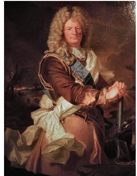
Sébastien Le Prestre de Vauban