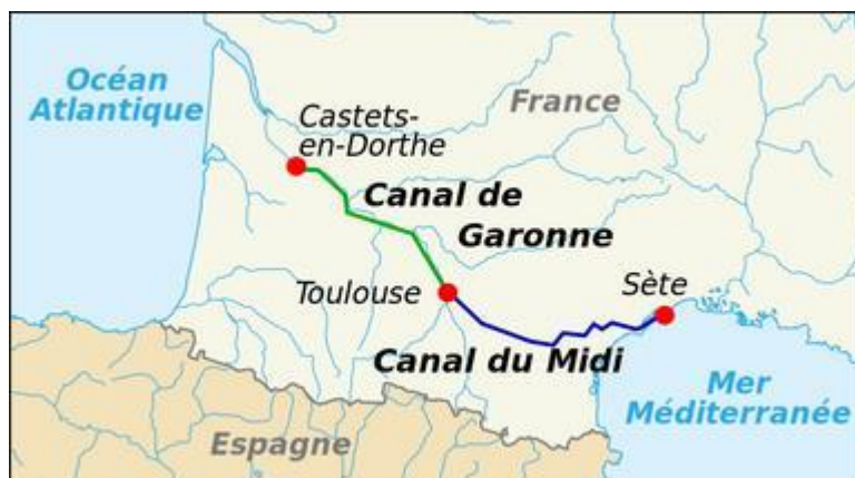
Le canal du Midi relie la Garonne à Toulouse au port de Sète sur la mer Méditerranée.