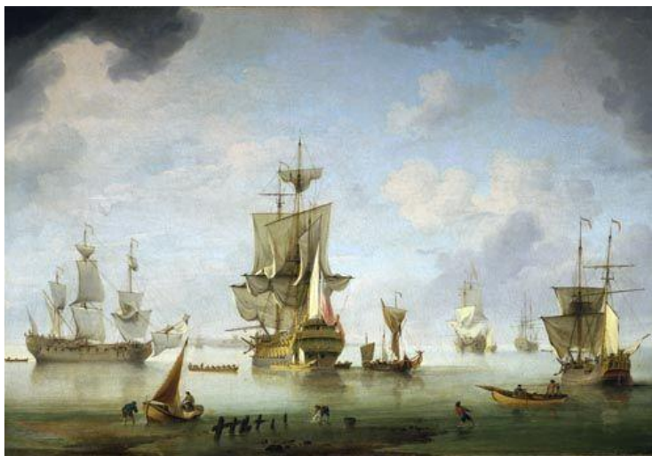
Marine marchande au XVIIe siècle