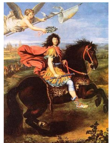
Louis XIV devant Maastricht pendant la guerre de Hollande (1672-1678)