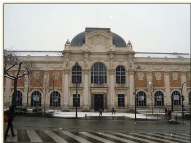
Manufacture des Gobelins à Paris aujourd'hui