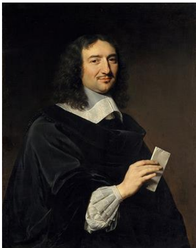
Colbert en 1655

Colbert laisse l'image d'un excellent gestionnaire , même si les résultats économiques du règne peuvent paraître très discutables en raison des fortes ponctions causées par les dépenses militaires, les constructions et les largesses du roi. Il ne faut pas oublier que Louis XIV a encore régné 32 ans après la mort de Colbert : tant que le ministre fut aux affaires, les budgets ont été à peu près maîtrisés ; les déficits ne cessent de s'accumuler après lui.