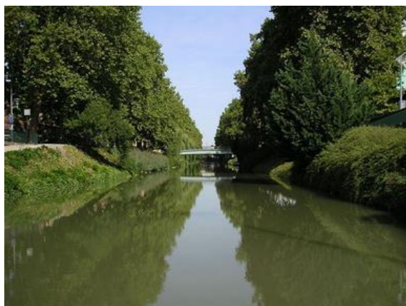
Le canal du Midi aux environs de Toulouse